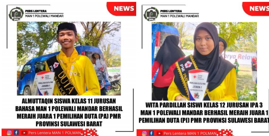
Gambar 4.6 Kegiatan PMR

SACTION II yang diselenggarakan oleh KWARCAB. Ambalan Ammana Wewang dan Andi depu MAN 1 Polewali Mandar mendapatkan piala bergilir karena telah memenangkan beberapa lomba yang diselenggarakan oleh SACTION II KWARCAB POLMAN.