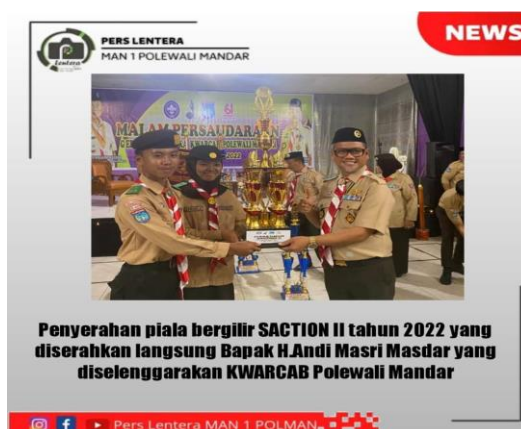
Gambar 4.5 Kegiatan Kepramukaan

Kegiatan OSIS diatas bertujuan untuk mengembangkan prestasi non-akademik dalam bidang sebid bela negara, sudah banyak prestasi yang digapai oleh anggota OSIS di MAN 1 POLEWALI Mandar Ini. Salah satu contohnya yaitu dalam lomba gerak jalan, putra-putri MAN 1 Polewali Mandar mendapat juara di perlombaan gerak jalan di tingkat kecamatan. Anggota yang ikut dalam perlombaan ini mayoritas anak OSIS dan selebihnya adalah siswa dan siswi madrasah.