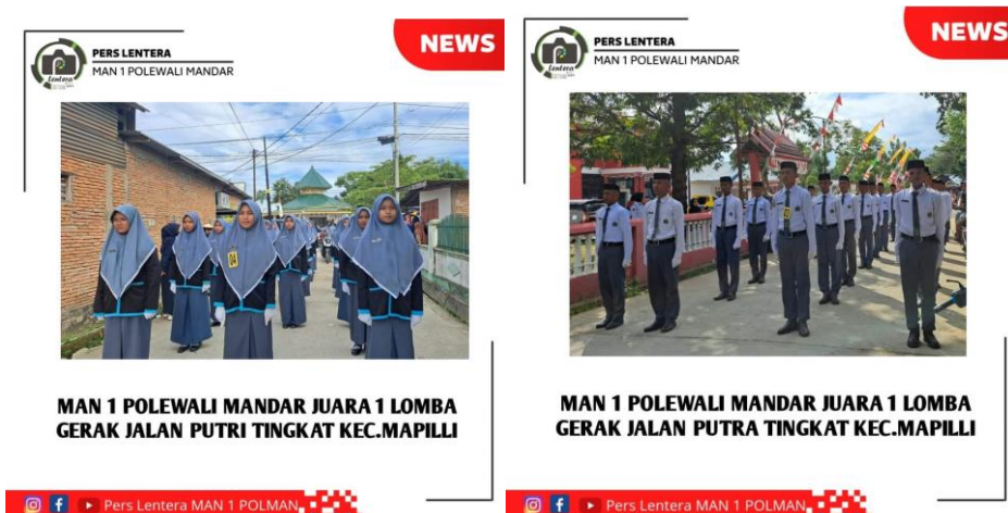
Gambar 4.4 Lomba Gerak Jalan

Kegiatan OSIS diatas bertujuan untuk mengembangkan prestasi non-akademik dalam bidang sebid bela negara, sudah banyak prestasi yang digapai oleh anggota OSIS di MAN 1 POLEWALI Mandar Ini. Salah satu contohnya yaitu dalam lomba gerak jalan, putra-putri MAN 1 Polewali Mandar mendapat juara di perlombaan gerak jalan di tingkat kecamatan. Anggota yang ikut dalam perlombaan ini mayoritas anak OSIS dan selebihnya adalah siswa dan siswi madrasah.