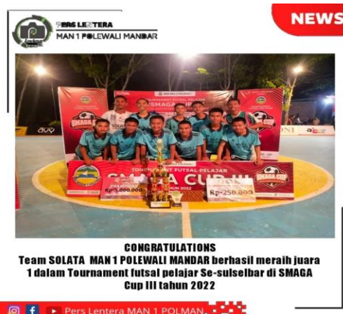
Gambar 4.8 Tim Futsal

Dari bidang keolahragaan, di MAN 1 Polman ini ada beberapa kegiatan ekstrakurikuler, seperti Futsal dan Basket. Ekskul tersebut bertujuan untuk membentuk generasi muda yang diharapkan dapat menjadi atlet di masa depan.