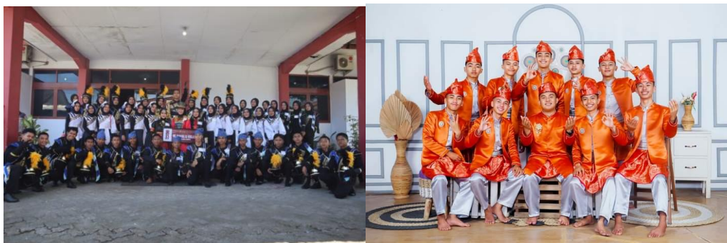
Gambar 4.7 Kegiatan Kesenian

Palang Merah Remaja (PMR) ini bertujuan untuk mengembangkan Prestasi Non-Akademik dalam berbagai bidang kepalangmerahan, kegiatan diatas adalah kegiatan pemilihan Duta PMR se-Sulbar dan anggota Putra-putri PMR MAN 1 Polman mendapatkan juara 1 dalam ajang DUTA PMR.