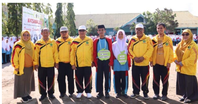
Gambar 4.3 Kegiatan MATSAMA 2022

Selain itu, tindakan pengarahan dan pembinaan dilakukan melalui staf struktural dan fungsional untuk mengembangkan, mempertahankan, memajukan, dan mempertahankan organisasi. Setiap pembina di MAN 1 Polman bertugas mengawasi kegiatan ekstrakurikuler tersebut agar sesuai dengan tujuan dan target yang ingin dicapai. Kegiatan ekstrakurikuler selalu diarahkan oleh pembimbing masing-masing.