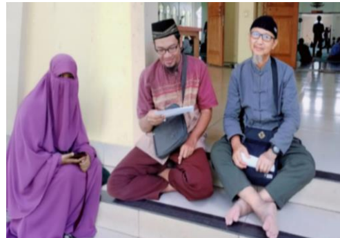
(المقابلة مع أستاذ النحو والحديث)