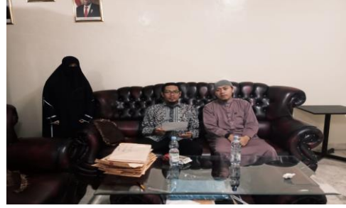
(المقابلة مع أستاذ أصول الفقه والبلاغة وأستاذ السيرة)