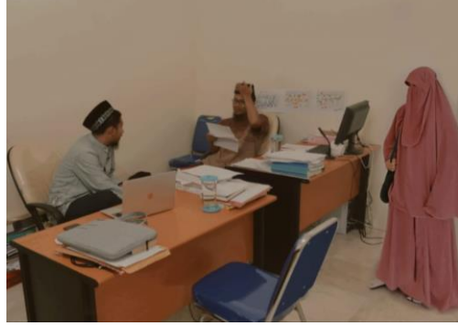
(المقابلة مع رئيس قسم تعليم اللغة العربية)