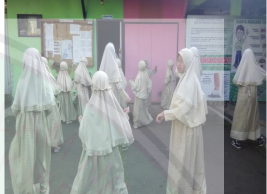
Senam Pagi Putri