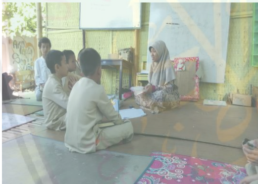
Tahfidz Qur'an di dalam Kelas