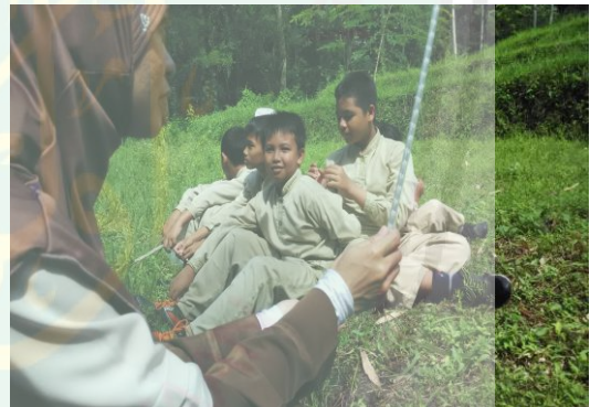
Pembelajaran Tsaqofah di Luar kelas