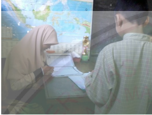
Pengecekan KHS oleh Wali Kelas