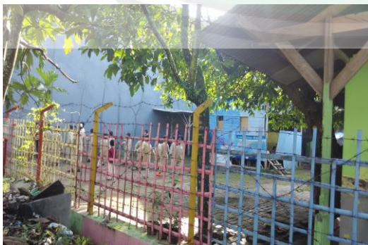
Senam Pagi Putra