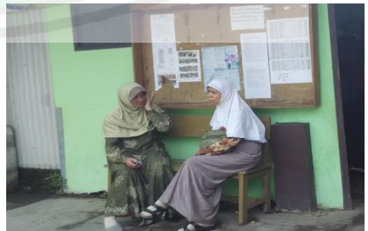
Kegiatan Mini Parenting