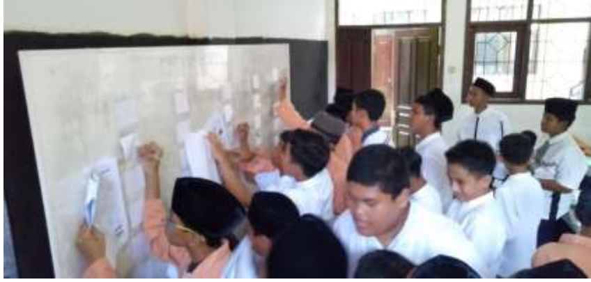
عملية التعليم في الفصل