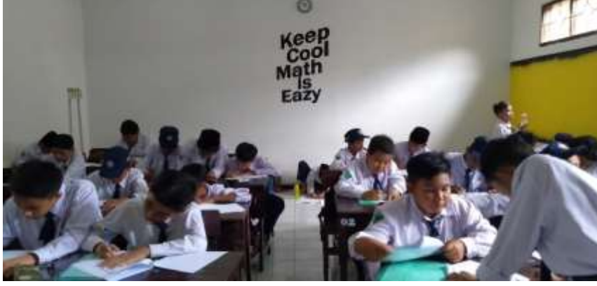
عملية التعليم في الفصل