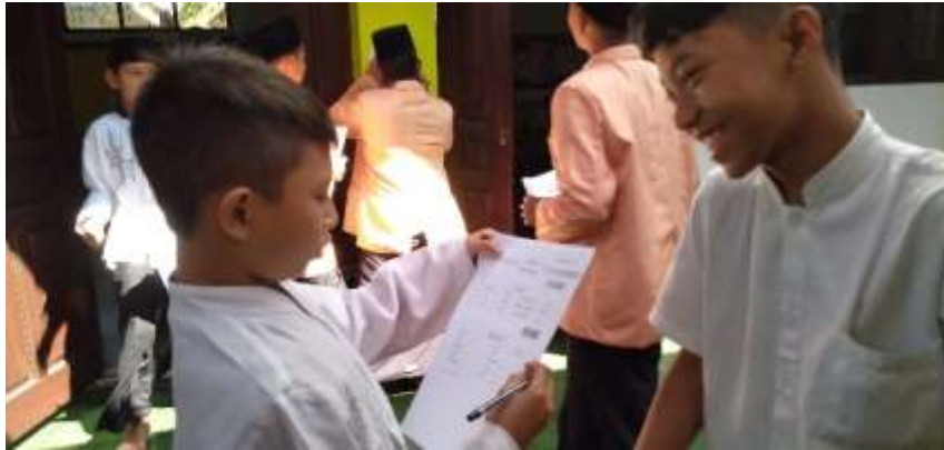
عملية التعليم خارج الفصل