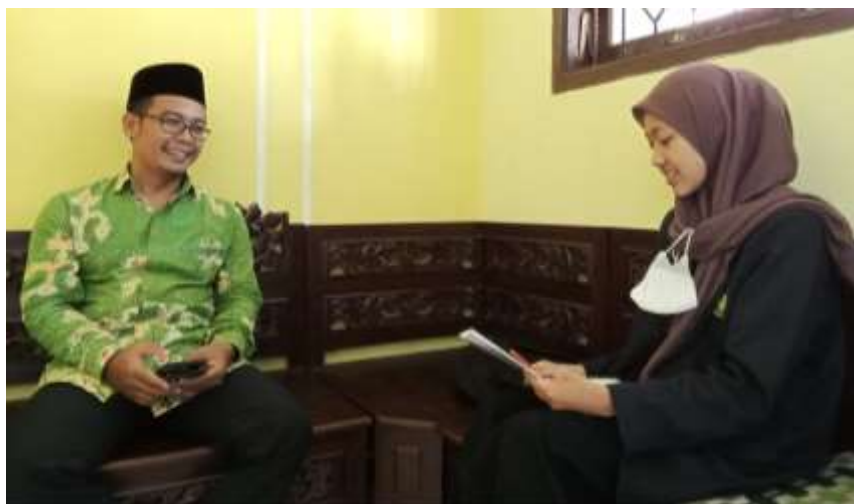
مقابلة مع أستاذ يوغا