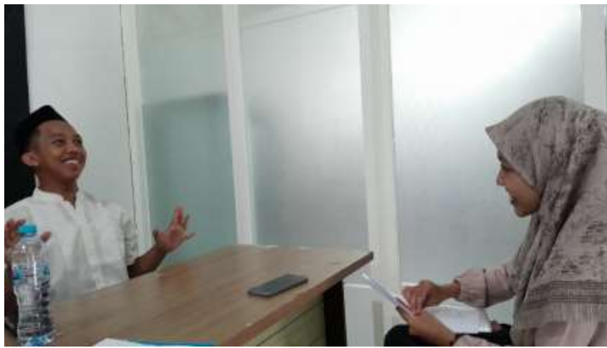
مقابلة مع أستاذ ساندي