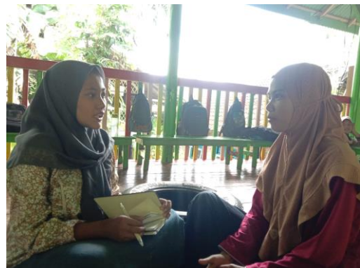
Bu Ifa (HW. IZK-18)