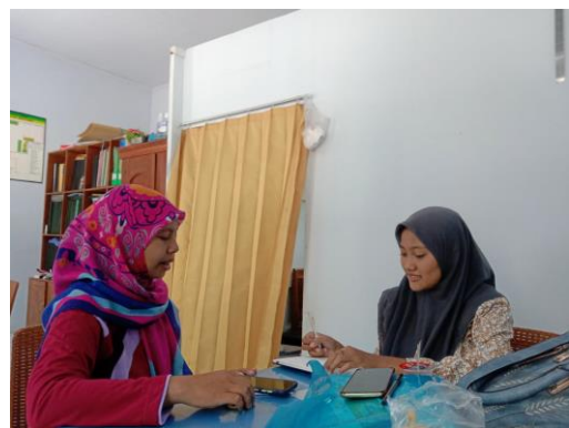
Bu Sulis (HW. SU-16)