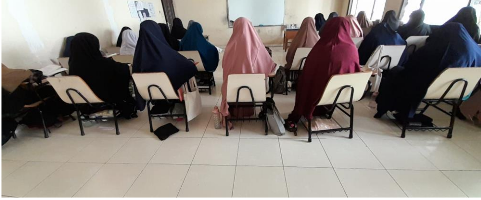
الملحق ١٣ : صورة حالة الفصل في التجربة الميدانية