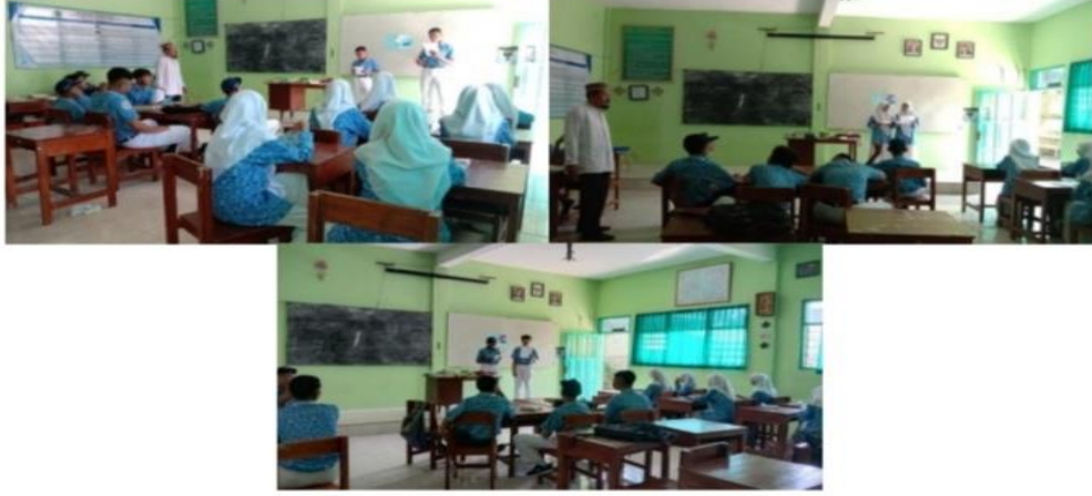
الشكل ٤,٣ يعرض نتائج المناقشة

في تنفيذ هذا التعلم التفاضلي من أجل إنتاج التفاضلي في المنتج في شكل اختلافات في نتائج مهام التعليم أو الاختلافات لتقييم نتائج تعلم الطلاب. يقوم المعلم بتعيين المهام لكل نمط تعليمي من أجل تحقيق أهداف التعلم. من الملاحظات التي تمت مواجهتها في الفصل ، أعطى المعلم مهام لأسلوب التعلم المرئي في شكل شرائح powerpoint slide ، بالنسبة لأسلوب التعلم السمعي ، أعطى المعلم مهمة عمل تسجيلات صوتية ، بينما بالنسبة لأسلوب التعلم الحركي ، أعطى المعلم مهمة عمل مدونات الفيديو.