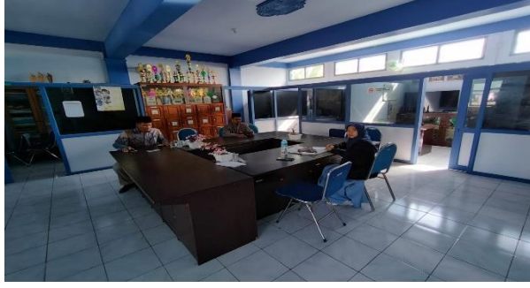
الشكل ٤,١ بعد تصريح البحث