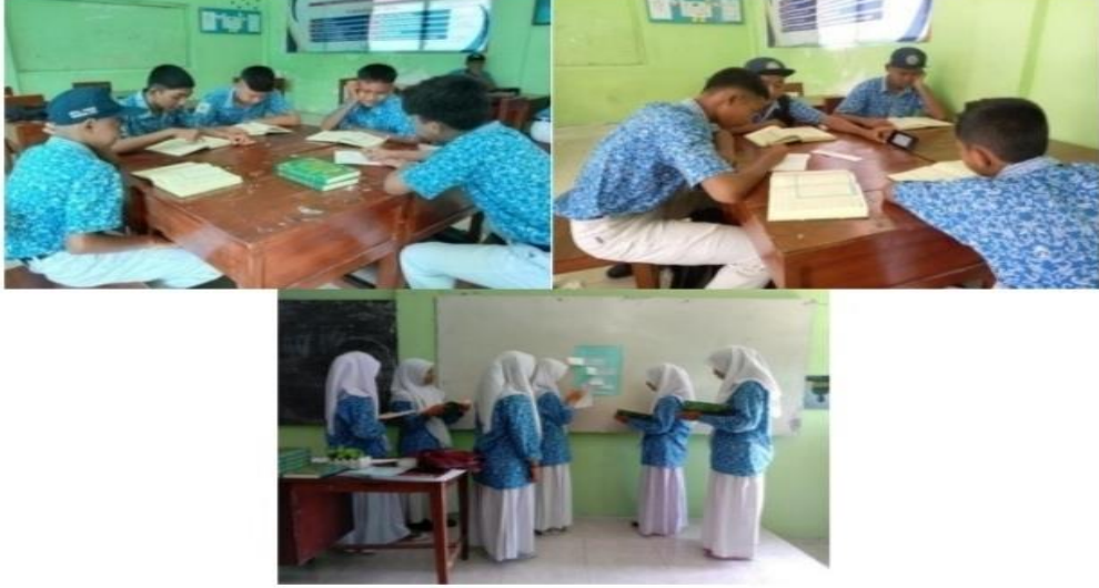
الشكل ٤,٢ تطبيق تعلم اللغة العربية القائم على التعلم التفاضلي

ليناقشوه معا. بعد ذلك ، قدم ممثلون من كل مجموعة نتائج مناقشاتهم أمام المجموعات الأخرى.