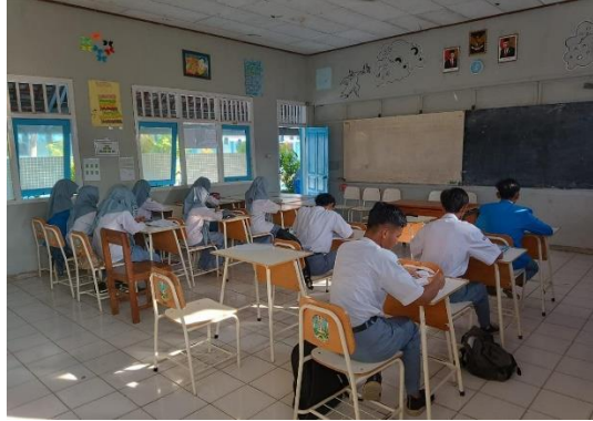
الشكل ٤،٤ الفصل تعلم الدراسية

السمعية ، يجب الانتباه إلى الهدوء والتشابه وصندوق الصوت وما إلى ذلك ، بينما بالنسبة لبيئة التعلم الحركية ، فإنه يوفر فصلا دراسيا واسعا وما إلى ذلك يتم مقابله مباشرة من قبل الباحثة في الفصل الدراسي .