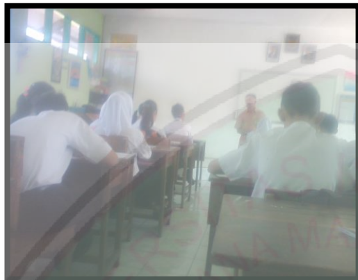
Kelas VIII C saat proses pembelajaran