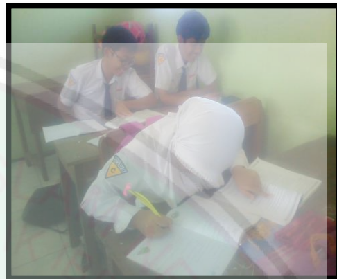
Siswa mengerjakan tugas LKS