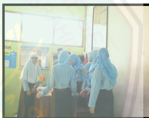
Siswa saling berinteraksi dan bekerjasama