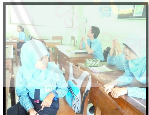
Siswa lambat belajar dan normal berinteraksi