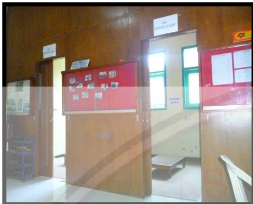
Ruang belajar di luar kelas bagi ABK