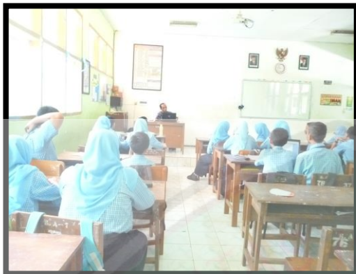
Kelas VII G saat proses pembelajaran