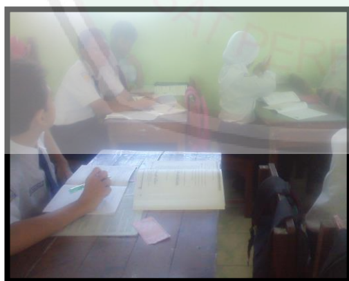
Siswa lambat belajar dan normal berinteraksi