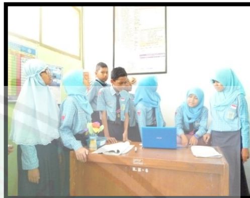
Siswa kelas VII C saat presentasi