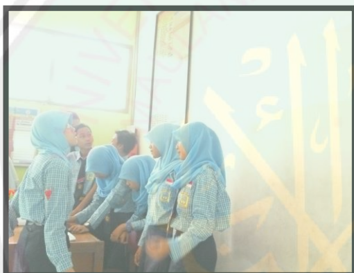
Siswa lambat belajar membaca slide saat presentasi