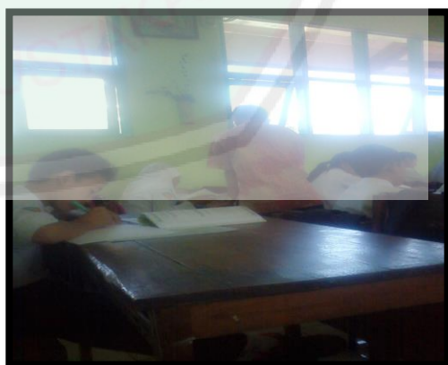
Guru dan siswa saling berinteraksi