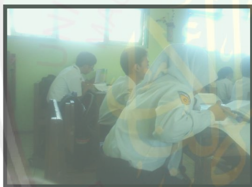
Siswa mengerjakan LKS