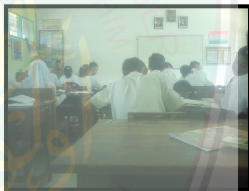
Suasana kelas saat mengerjakan tugas LKS