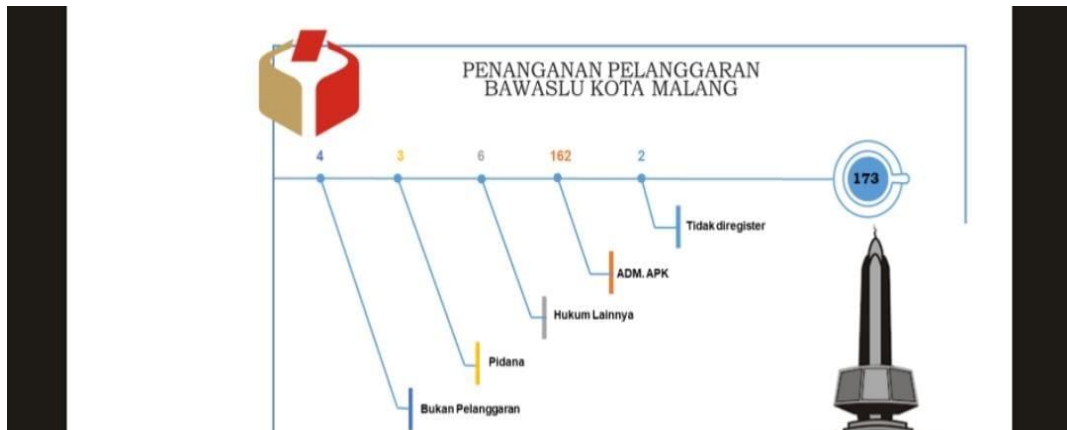
Lampiran Laporan Penindakan Bawaslu Kabupaten/Kota 7 Rekapitulasi Temuan Dugaan Pelanggaran Pemilu Bawaslu Kota Malang per Tahapan