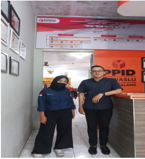
Bapak Galang divisi pelanggaran, penyelesaian sengketa di Kantor Bawaslu Kota Malang