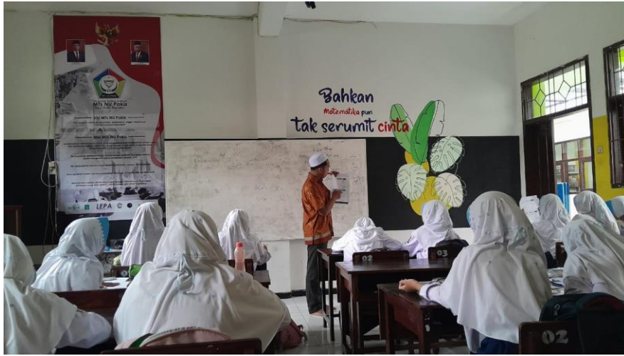
الملاحظة في تعليم اللغة العربية