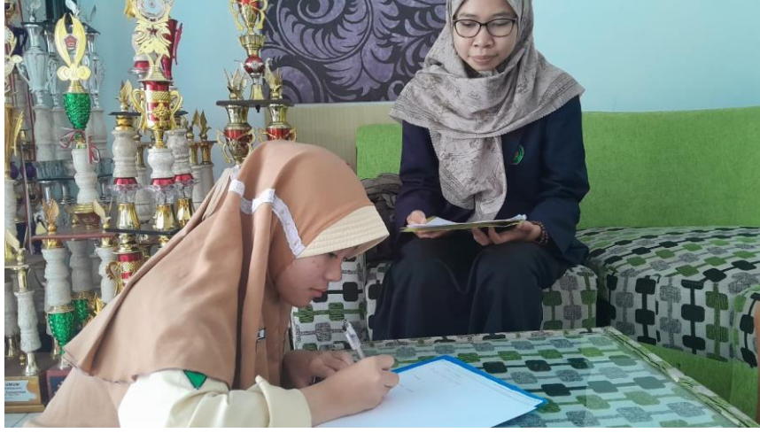
المقابلة مع التلميذة