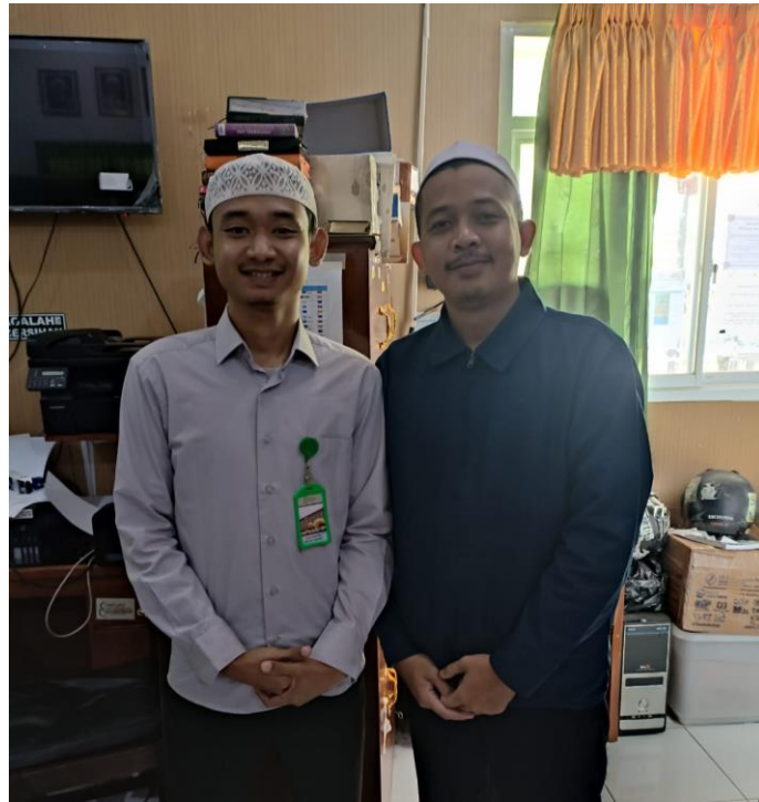
الصورة (٣) التصوير مع نائب رئيس المناهج