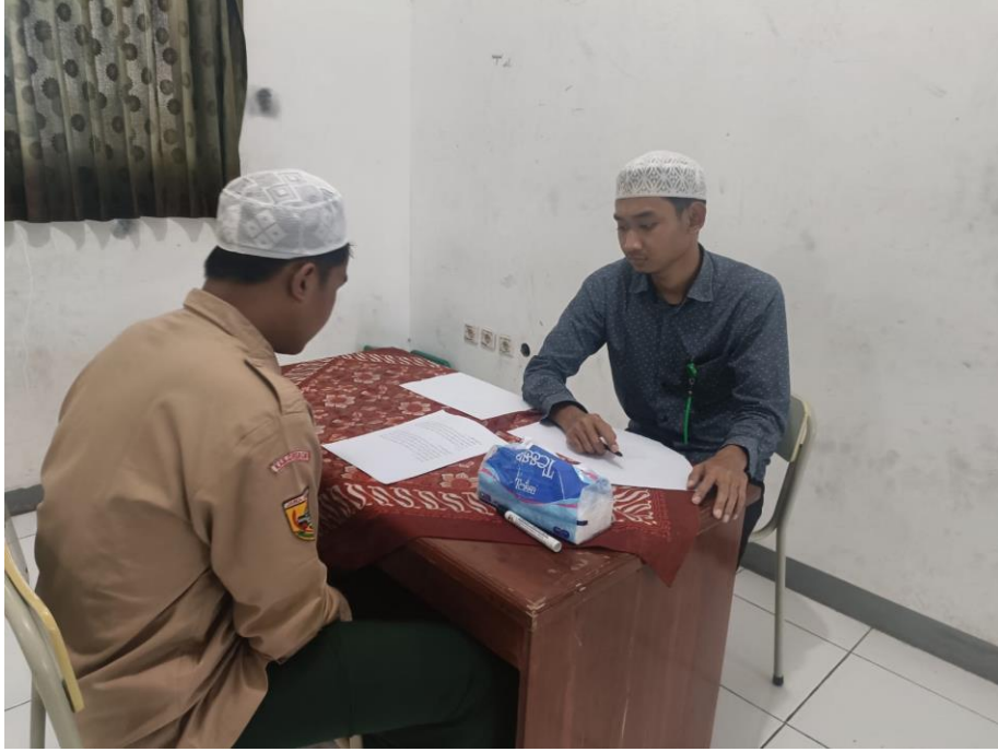
الصورة (٣) تنفيذ الاختبار الشفوي في فصل XI.I