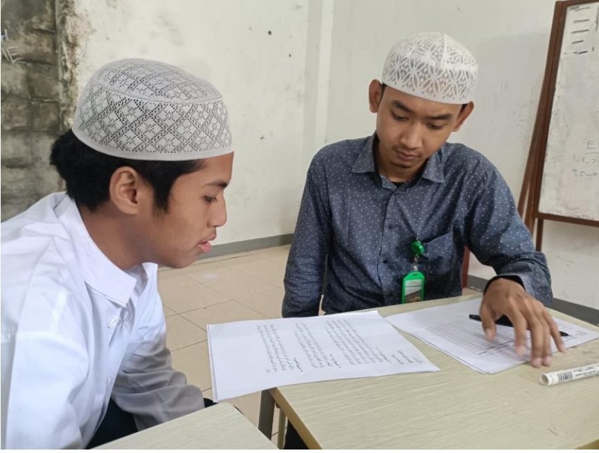
الصورة (١) تنفيذ الاختبار الشفوي في فصل XI.III