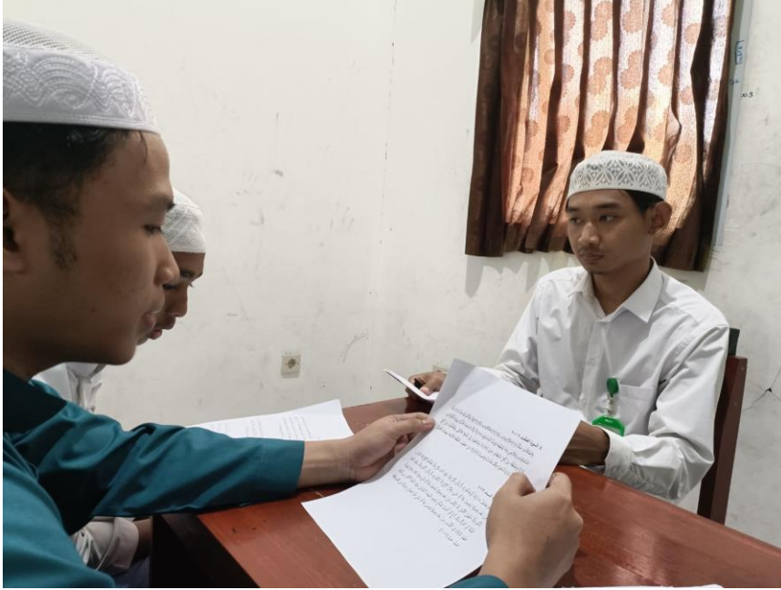
الصورة (٢) تنفيذ الاختبار الشفوي في فصل