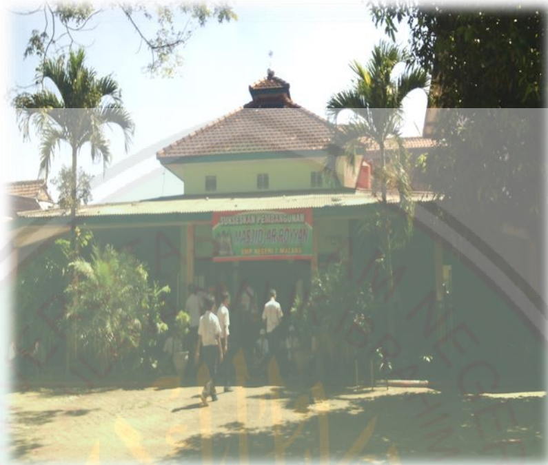
Bangunan Masjid Ar-Royyan SMP Negeri 7 Malang