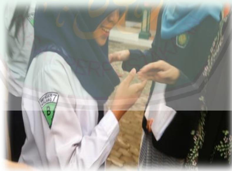
Kegiatan Berjabat Tangan