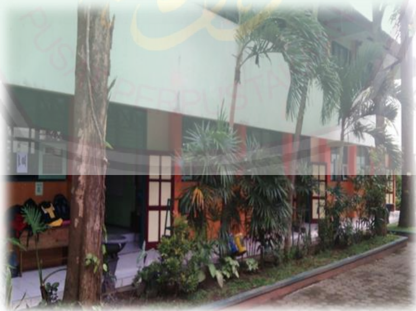
Gedung Kelas SMP Negeri 7 Malang