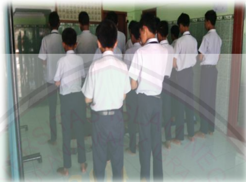
Kegiatan Shalat Berjamaah