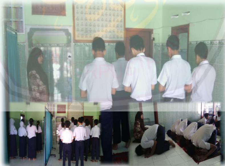
Kegiatan Praktik Shalat