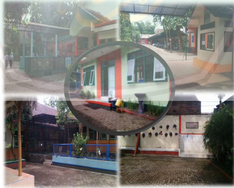
Lingkungan Sekolah SMP Negeri 7 Malang