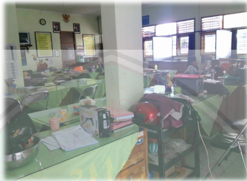
Ruang Guru SMP Negeri 7 Malang