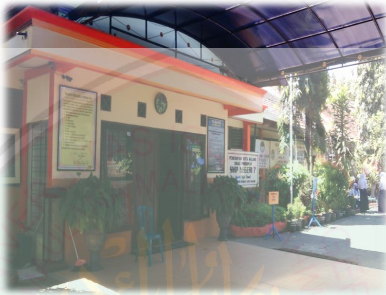
Bangunan SMP Negeri 7 Malang Tampak Depan