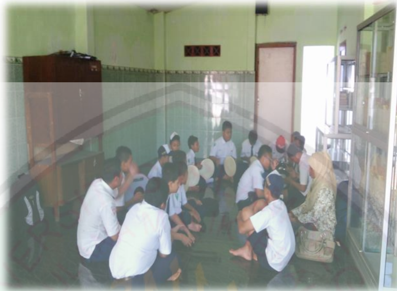
Kegiatan Latihan Banjari