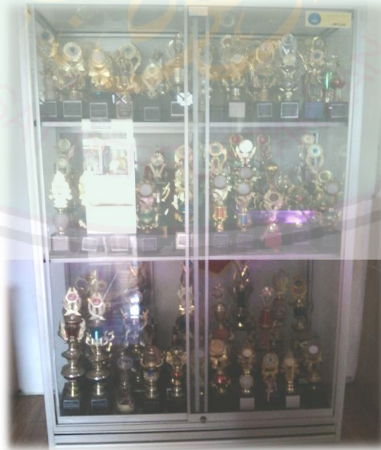
Piala-Piala yang Diraih SMP Negeri 7 Malang