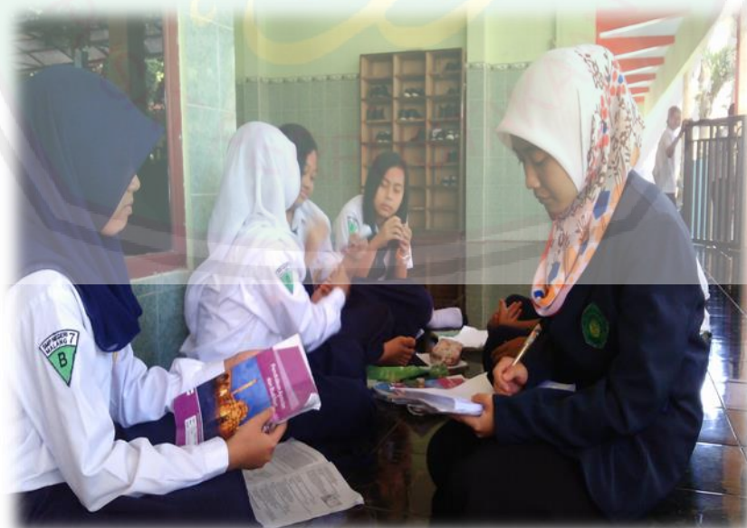
Wawancara dengan Siswi Kelas VII B