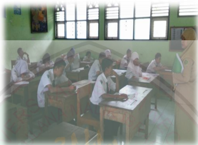
Suasana Kegiatan di Kelas