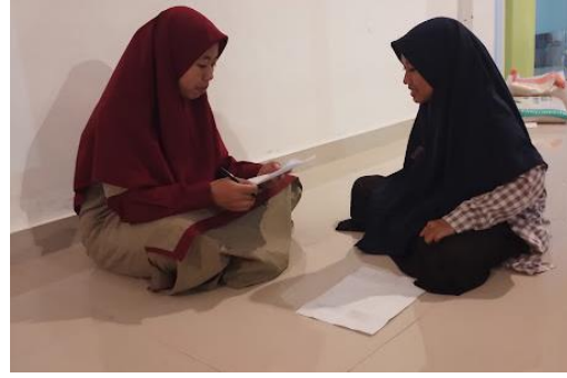
المقابلة مع قسم اللغة