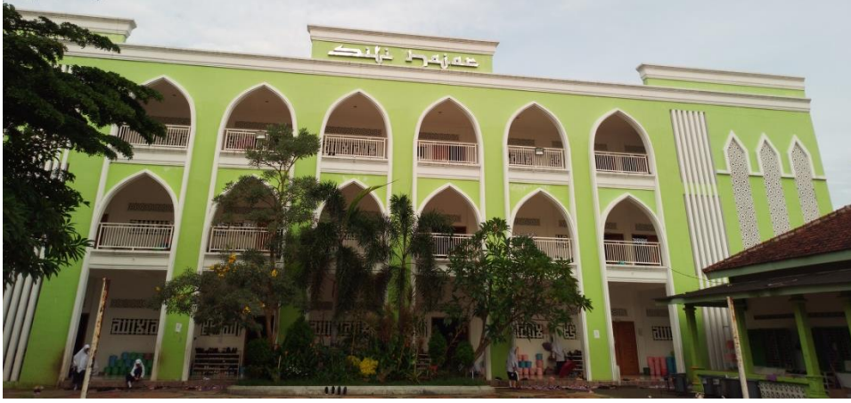
مبنى حجر (مسكن التلميذات الفصل الأول والثاني)