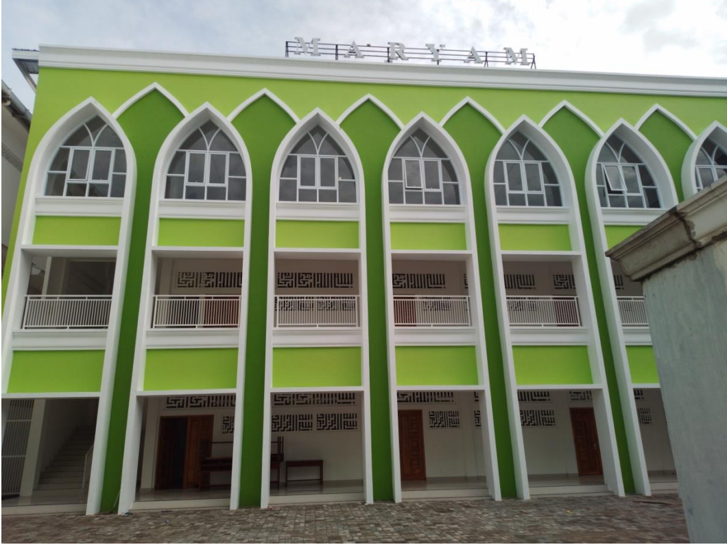
مبنى مريم (قاعة الاجتماع)