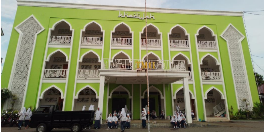
مبنى خديجة (مسكن التلميذات الفصل الثالث)