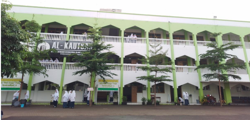
مبنى الكوثر لعملية التعليم