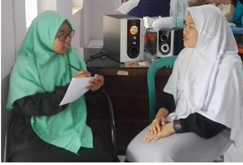
المقابلة مع أستاذة مركز اللغة