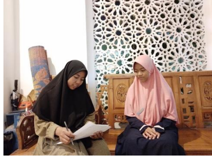
سبورة خاصة لكتابة المفردات