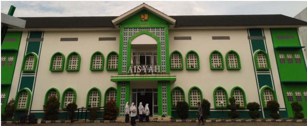
مبنى عائشة (مسكن التلميذات الفصل الرابع)