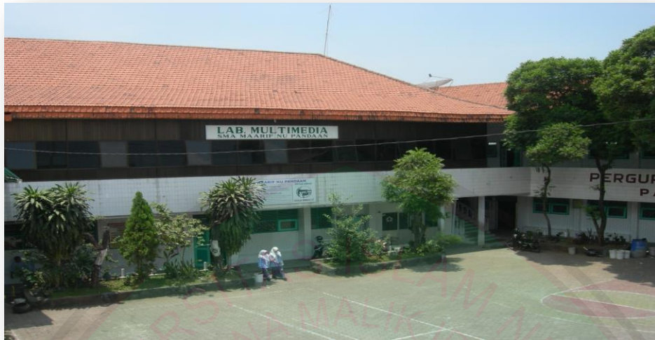
Gambar Sekolah SMA Maarif NU Pandaan