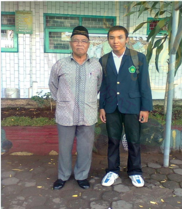
Kepala Sekolah bersama Mahasiswa Peneliti