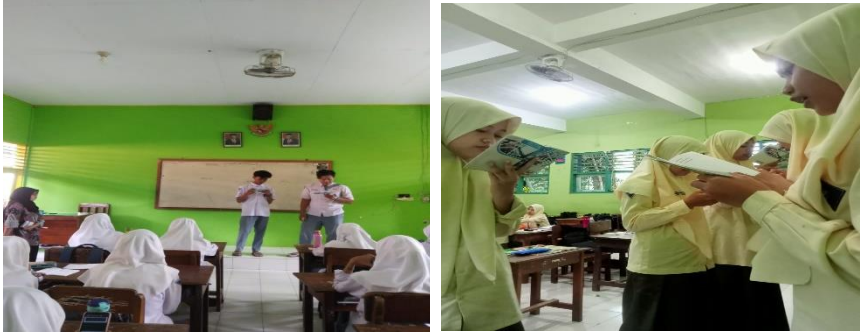
صورة ٤: الأنشطة تطبيق المحادثة