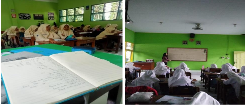
صورة ٣: الأنشطة إثراء المفردات

في الفصل. لذلك في تقوية هذه اللغة العربية، يركز التلاميذ على إتقان مهارة الكلام. لأنه في البداية تم تشكيل تقوية اللغة العربية لترقية مهارة الكلام التلاميذ في المدرسة. بناءً على ملاحظة الباحثة وعززها أيضاً وجود التوثيق، أن المدرسة قد تنفذ تقوية اللغوية ببرنامج تقوية اللغة العربية، كما معروض بوثائق التالية: