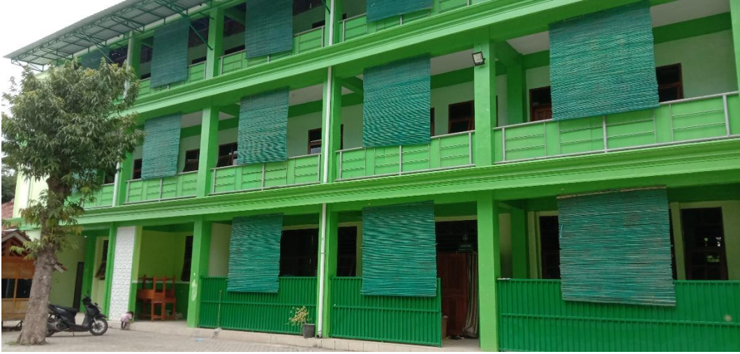
صورة ١١ : مبنى سكن التلميذات