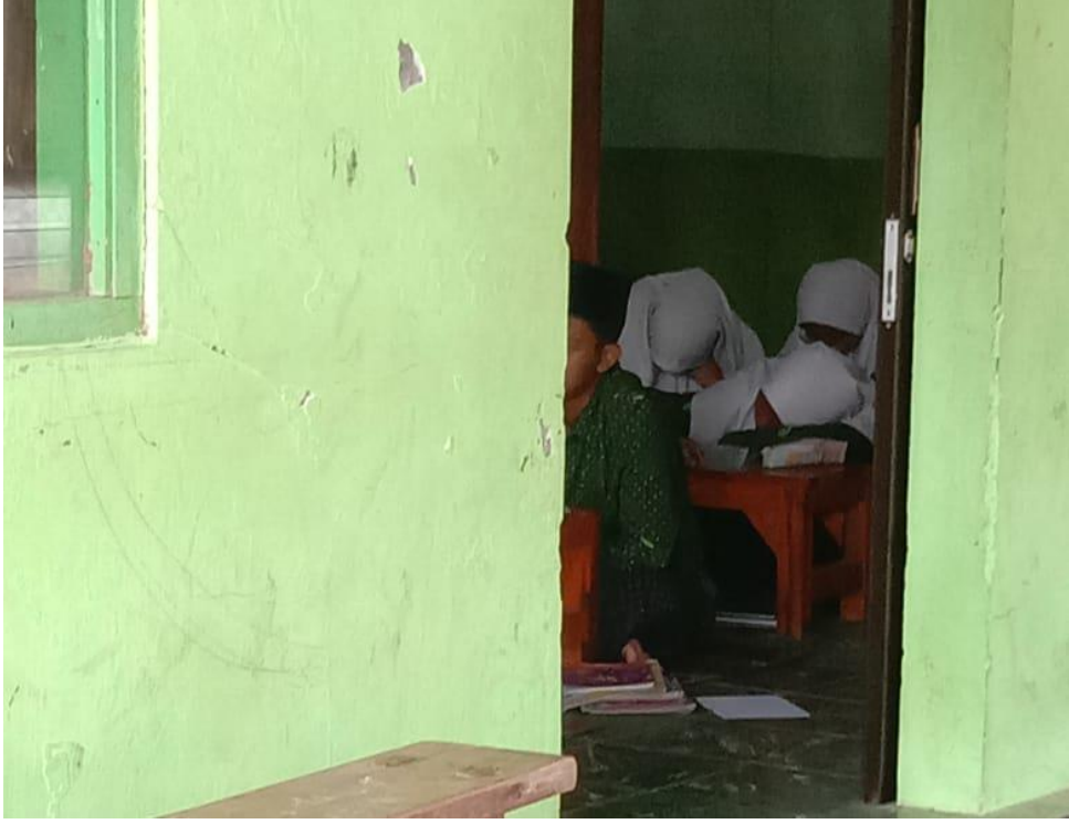
صورة ١٣ : عملية التعليمية