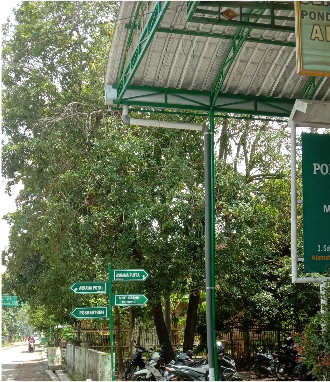
صورة ١٠ : الأعلومة