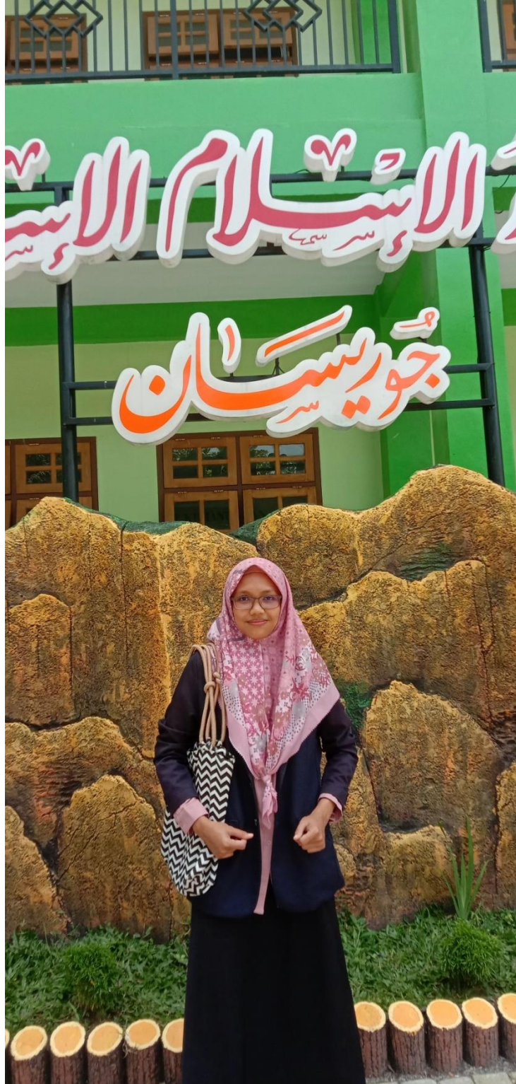
صورة ٩ : صورة الباحثة حين عملت البحث