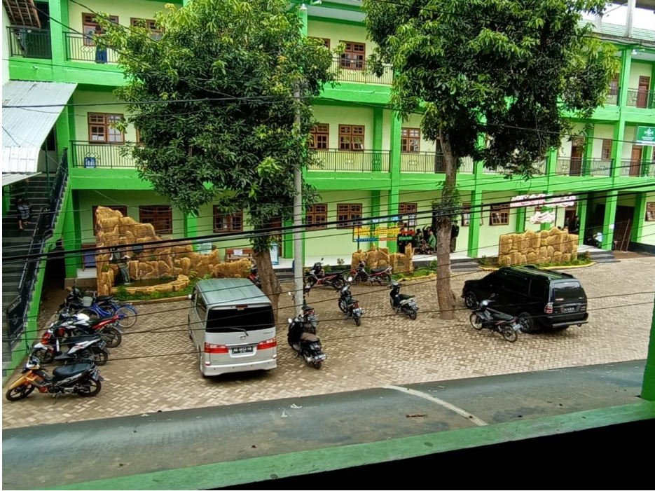
صورة ١٤ : مبنى المدرسة