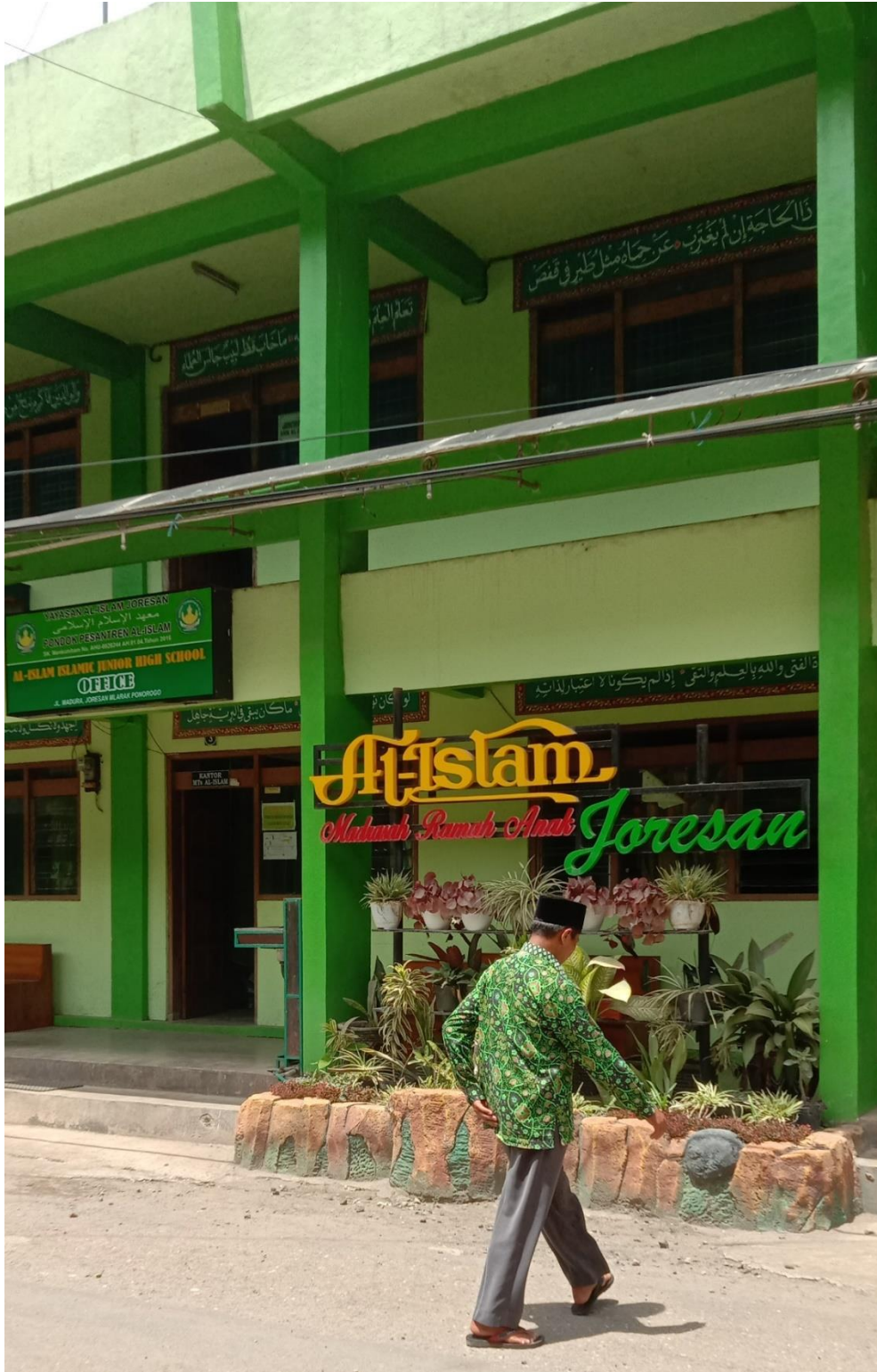
صورة ٨: إدارة المدرسة الإسلامية المتوسطة الإسلامية جوريسان