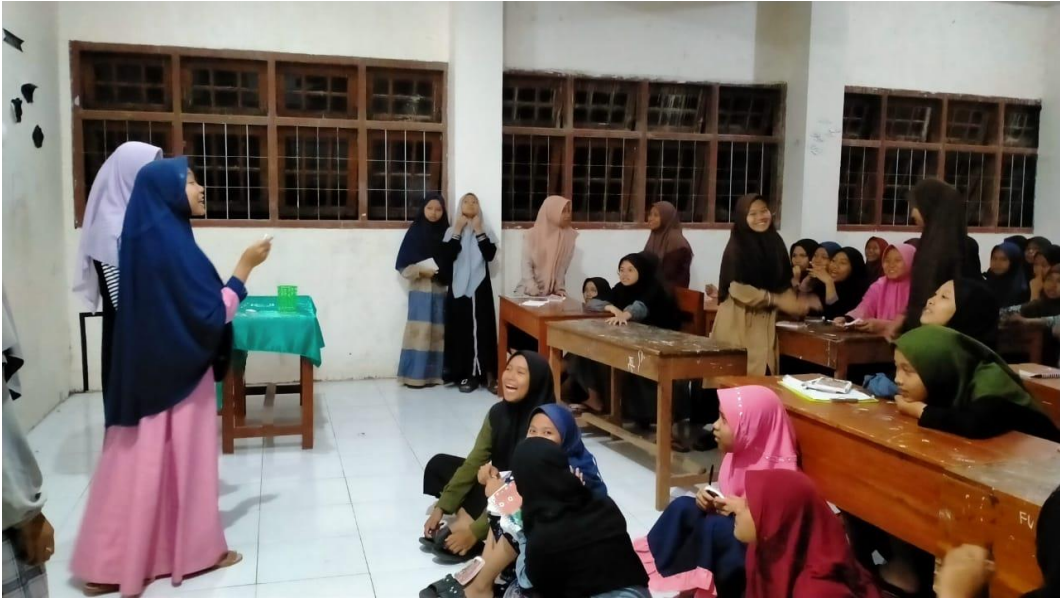
صورة ١٢ : تشجيع اللغة في سكن التلميذات