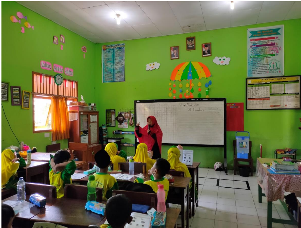
Pembelajaran Bahasa Arab di SDIT Iqra 2 Kota Bengkulu