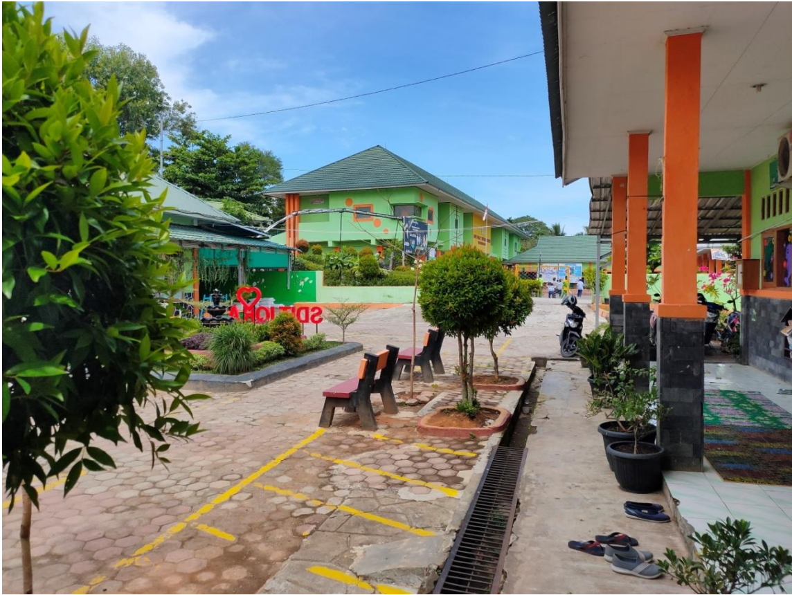
Penampakan lingkungan sekolah SDIT Iqra 2 Kota Bengkulu