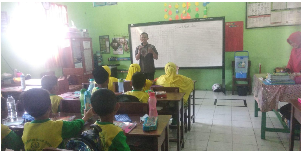
Pelaksanaan Pre-Test Pembelajaran Bahasa Arab Menggunakan Media film Kartun