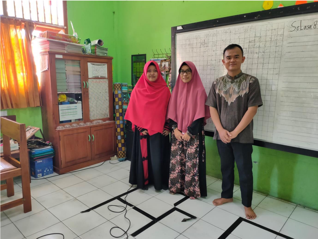
Foto Bersama Guru Bidang Study