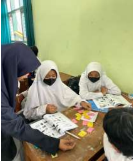
FOTO SELAMA PENELITIAN