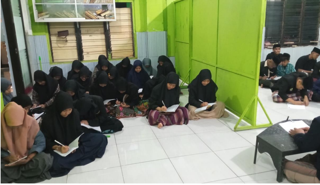
عملية التعليمية مادة الإملاء