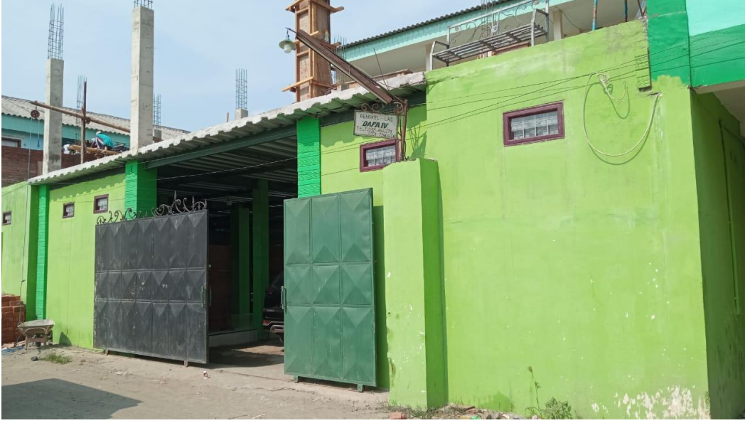
صورة معهد دار الفلاح الرابع الإسلامي في التحفيظ والقراءات جوكر جومبانج