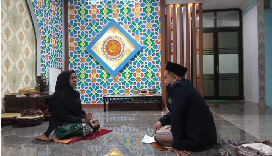
المقابلة معلمة مادة الإملاء