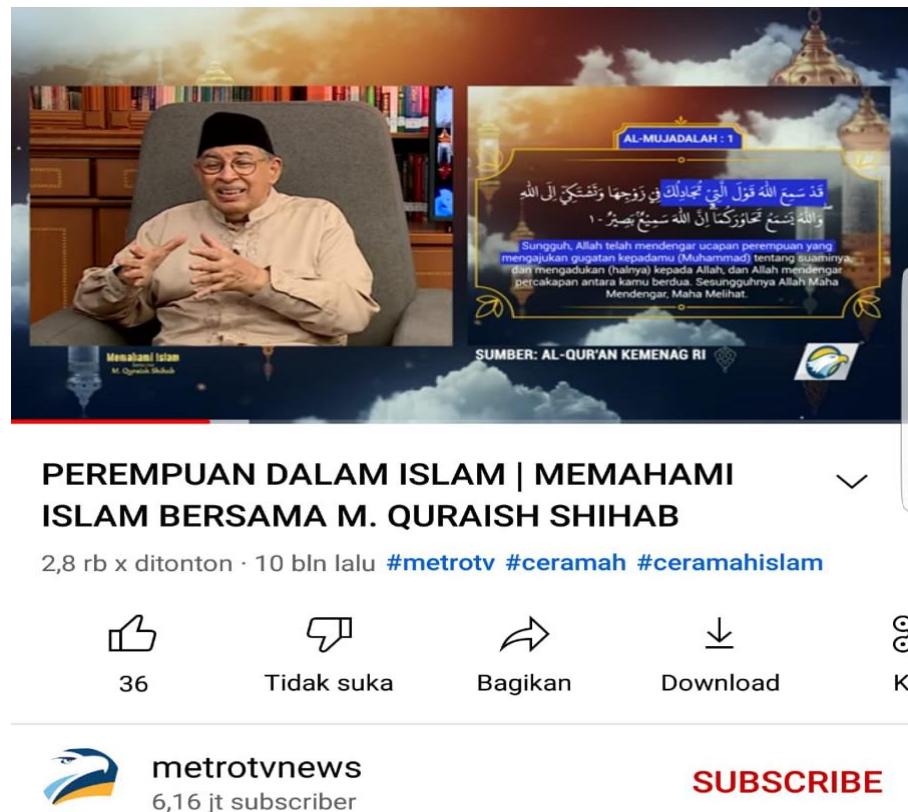
Gambar 1. Cuplikan video Talkshow Quraish Shihab

hormati. Berikut cuplikan video Talkshos Quraish Sihab pada Youtube Mterotvnews.