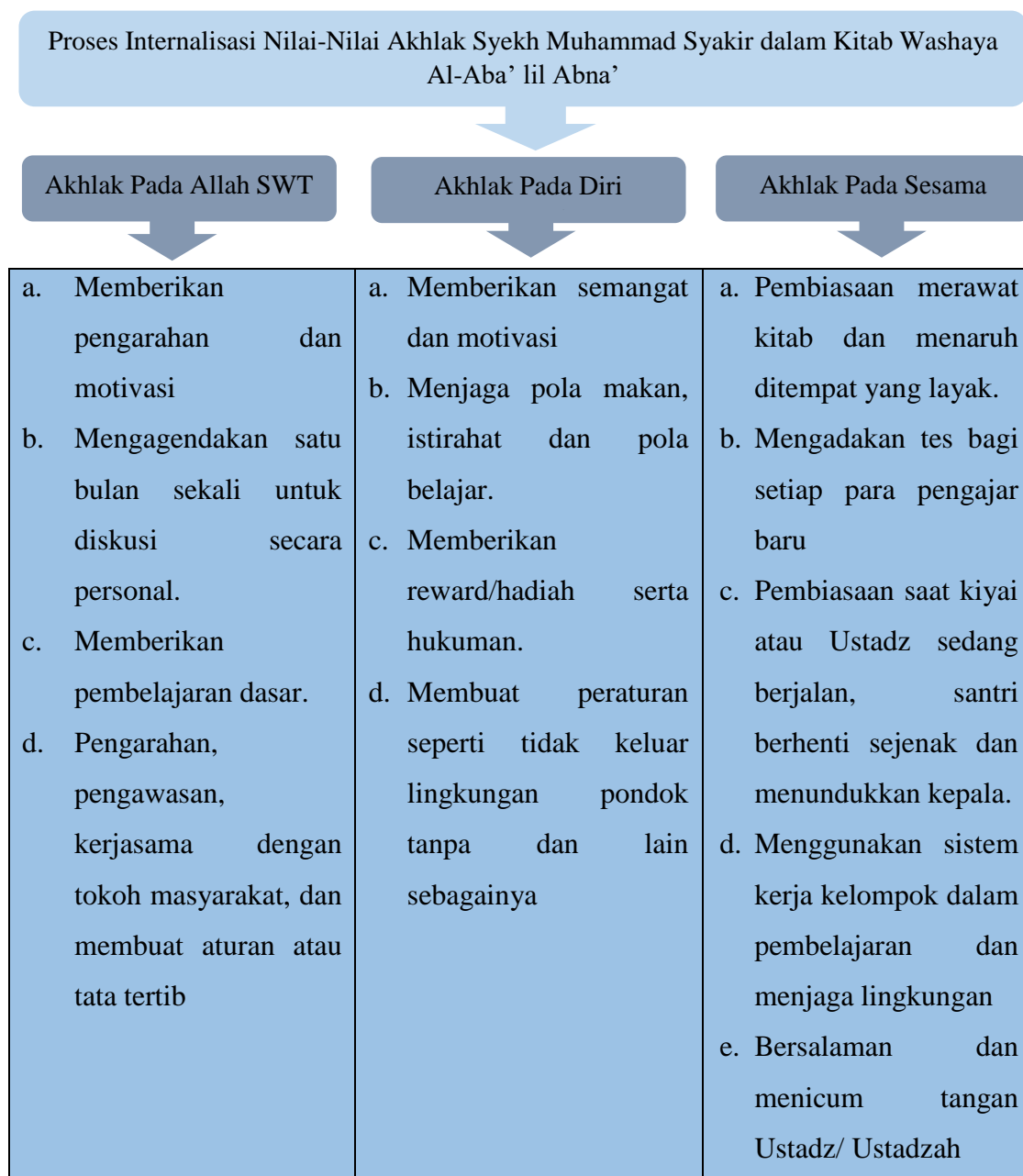
Gambar 4.2 Diagram Proses Internalisasi Nilai-Nilai Akhlak

Dari hasil wawancara di atas, maka bisa disimpulkan bahwa internalisasi nilai dalam kitab Syekh Muhammad Syakir di pondok pesantren Qodiriyah Sulaimaniyah melalui berbagai macam kegiatan sehingga mampu membentuk sebuah nilai yang diharapkan dalam kitab