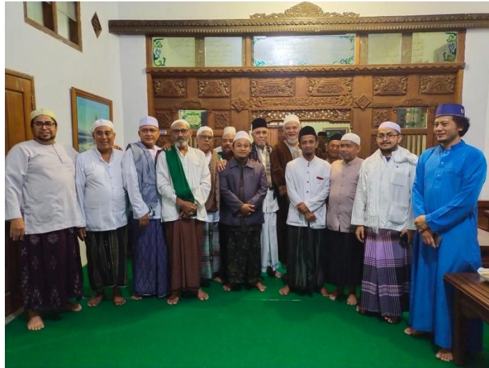
Kegiatan Rutin Bulanan (Dalailul Khairat santri bersama habaib dan warga)