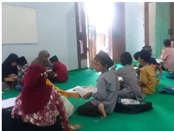
Kegiatan Diniyah dan TPQ