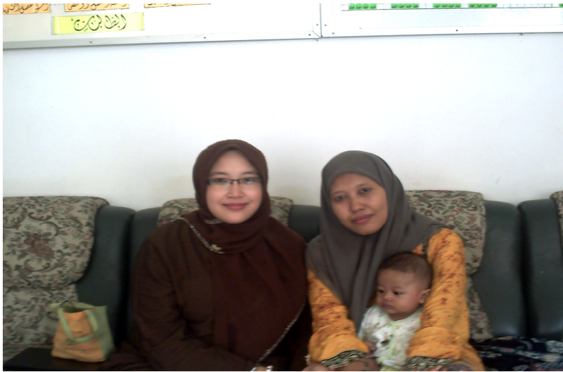
Peneliti bersama dengan seorang guru yang lulus sertifikasi.