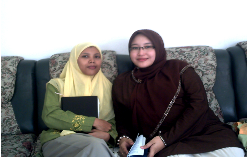
Peneliti bersama dengan alumnus yang sekarang mengajar di pesantren tersebut.