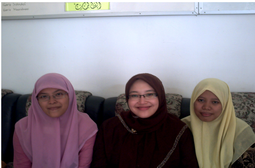
Peneliti bersama dengan alumnus yang sekarang menjadi tenaga pengajar di pesantren tersebut.