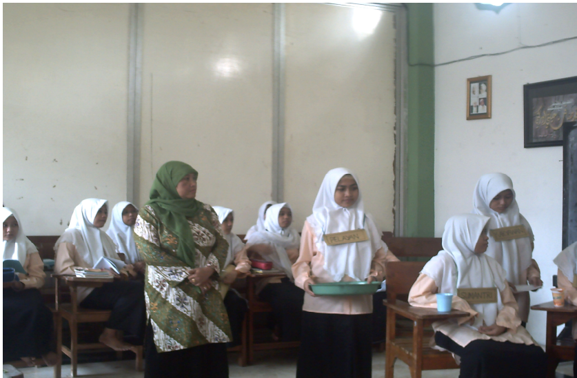
Foto Suasana Pengajaran Di Madrasah Salafiyah Mu'adalah Pasuruan