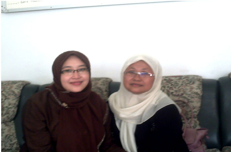
Peneliti dengan seorang guru senior ( \pm 18 tahun) mengajar di Pesantren Salafiyah.