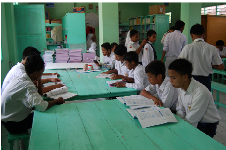
Proses Kegiatan Belajar Mengajar Siswa-siswi SMP Islam Pasuruan