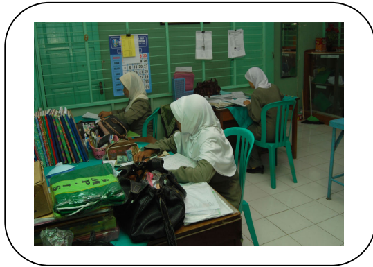
Ruang Guru SMP Islam Pasuruan