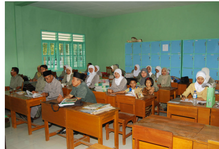
Rapat Guru SMP Islam Pasuruan