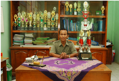
Kepala Sekolah SMP Islam Pasuruan