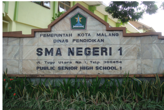
SMA NEGERI 1 MALANG