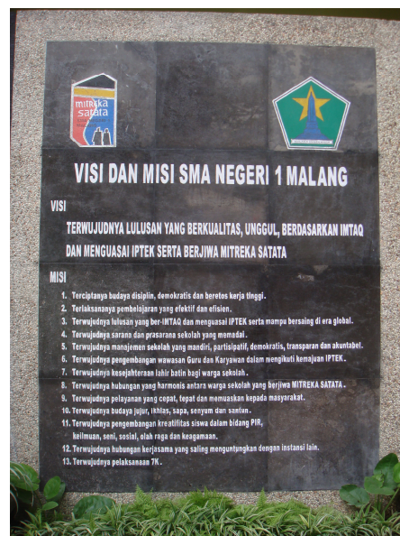
Visi dan Misa SMA Negeri 1 Malang