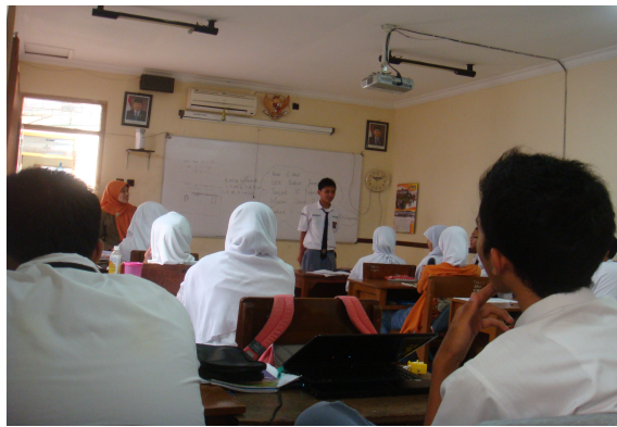
Suasana Belajar-Mengajar Program Akselerasi Kelas X