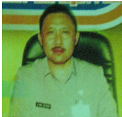
Kepala Sekolah SMA Negeri 1 Malang