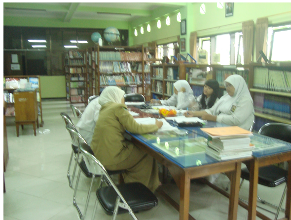
Suasana di Perpustakaan