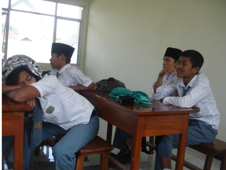
Siswa MA Almaarif Singosari Malang