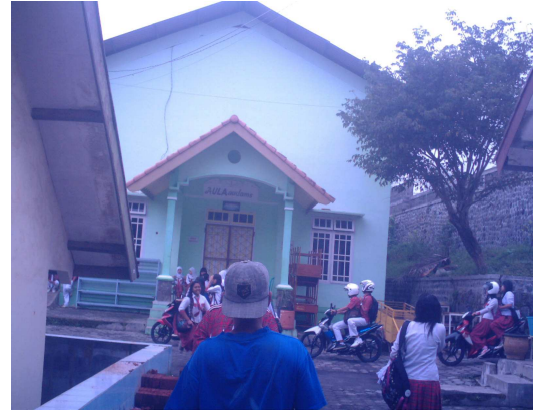
8. Ruang Aula