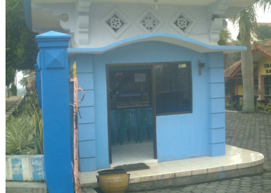
11. Pos Satpam