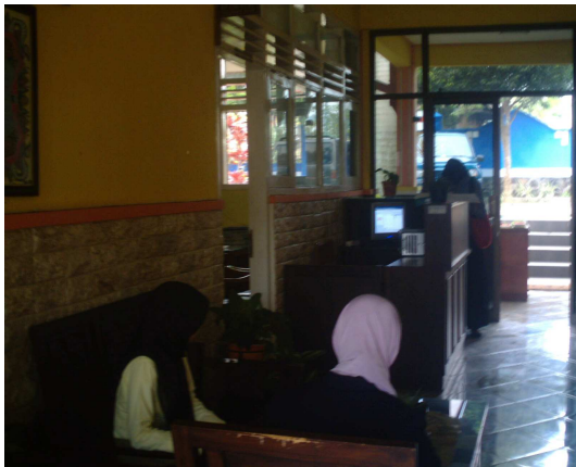
3. Ruang Tamu