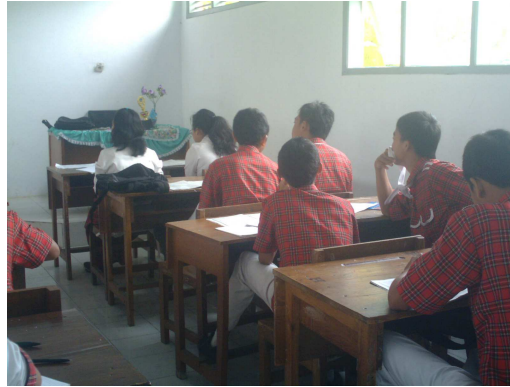
2. Siswa konsentrasi mendengarkan penjelasan peneliti