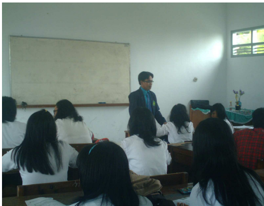
3. Peneliti bertanya pada siswa