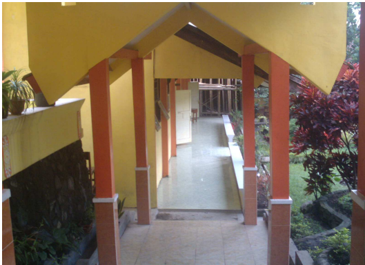
10. Lorong menuju ke kelas X-5