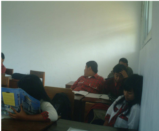
11. Siswa sudah selesai kerja kelompok