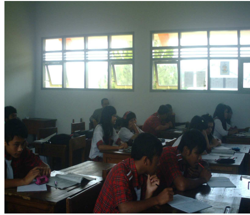
8. Siswa konsentrasi mengerjakan tugas