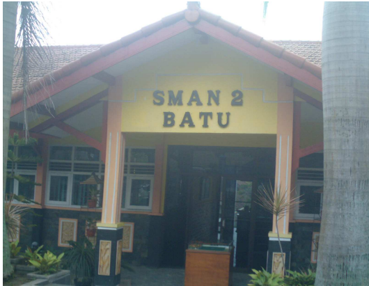
1. Lokasi Depan SMAN 02 Batu