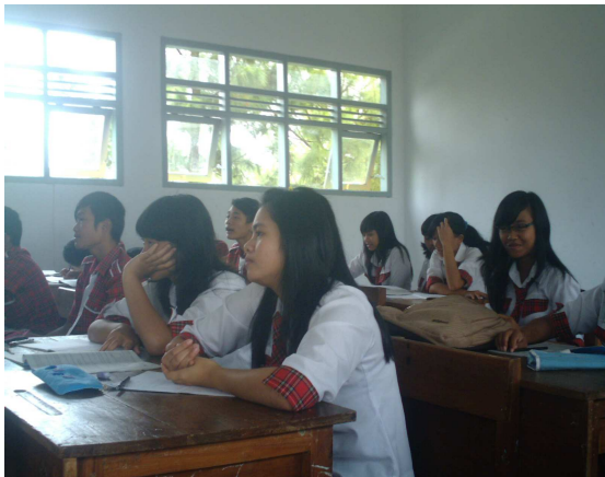
9. Siswa mendengarkan cerita dari peneliti