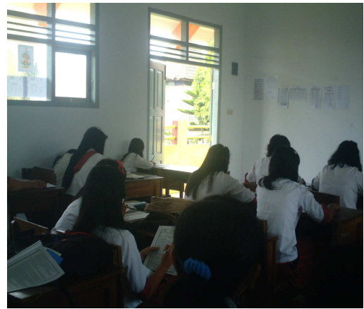
12. Siswa konsentrasi membaca buku LKS