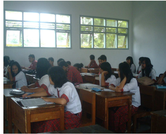
10. Siswa mendengarkan jawaban dari kelompok lain