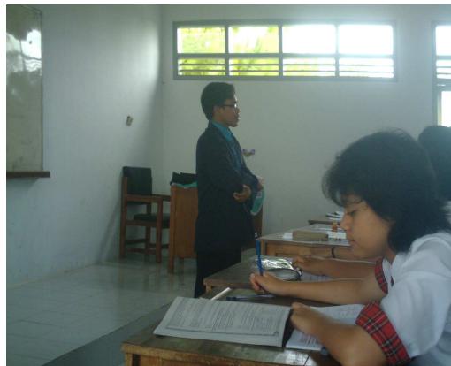
4. Peneliti mendengarkan penjelasan siswa