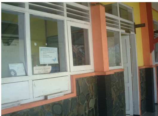
5. Ruang TU