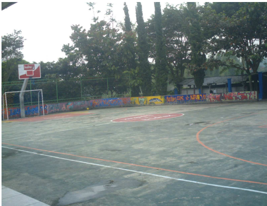
12. Lapangan Olahraga