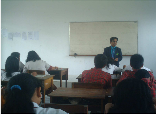
1. Peneliti Menjelaskan Pelajaran