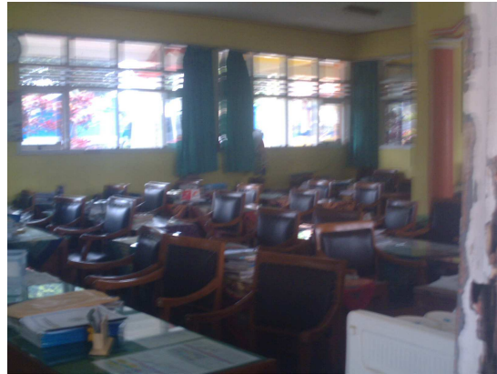
2. Ruang Guru