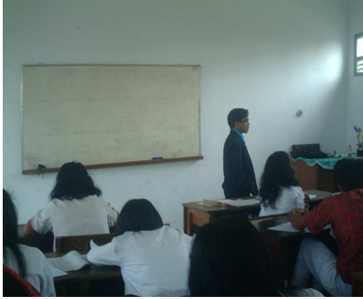
7. Peneliti menunjuk salah satu siswa