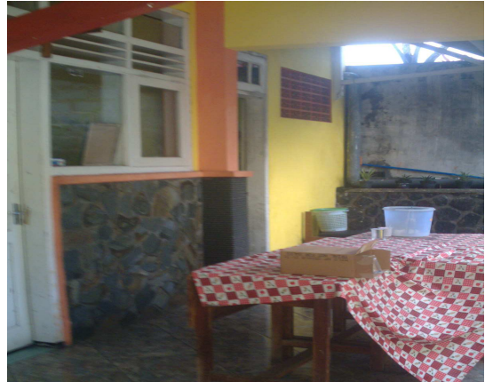
4. Ruang Osis