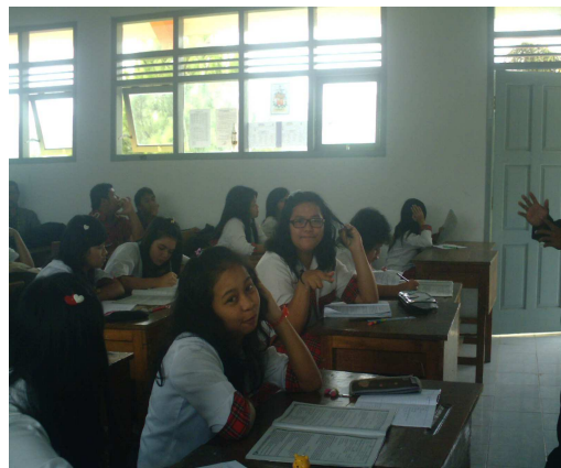
6. Siswa konsen dengan pertanyaan Peneliti