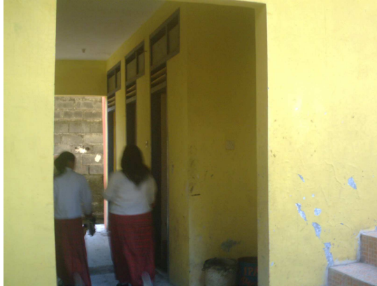
13. Kamar Kecil/WC