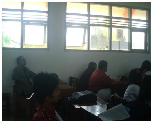
5. Siswa menyimak pelajaran