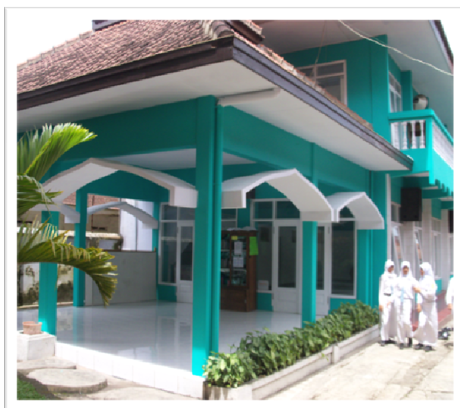
Masjid Al-Munawwar, sebagai pusat pembinaan keagamaan oleh BDI