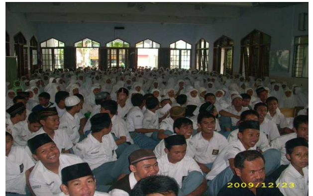
Para siswa sedang mendengarkan pengajian yang di adakan BDI