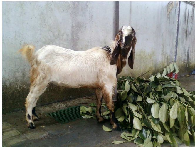
Kambing untuk kurban di hari raya Idul adha