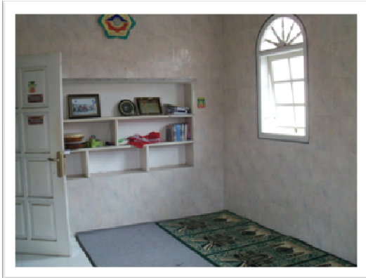
Kantor kerja Badan Dakwah Islam SMA Negeri 1 Kepanjen