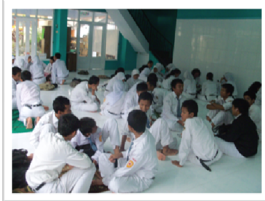
Kegiatan diskusi untuk pelaksanaan program BDI