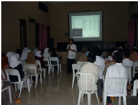
Kegiatan Studi Islam Intensif (SII) yang di adakan oleh BDI