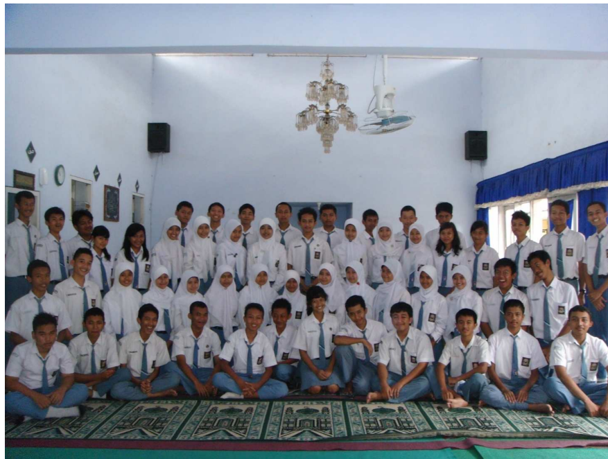
SUSUNAN PENGURUS INTI BDI