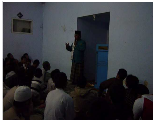
Kegiatan kajian rutin di masjid Al-Munawwar