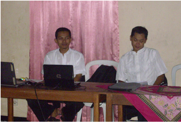
Pemateri di kegiatan Studi Islam Intemsif (SII) yang juga mantan Alumni BDI