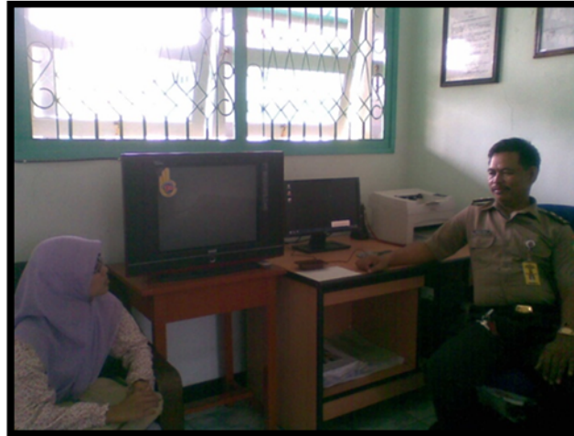
(Wawancara dengan anggota KPLP Lembaga Pemasyarakatan Anak Blitar)