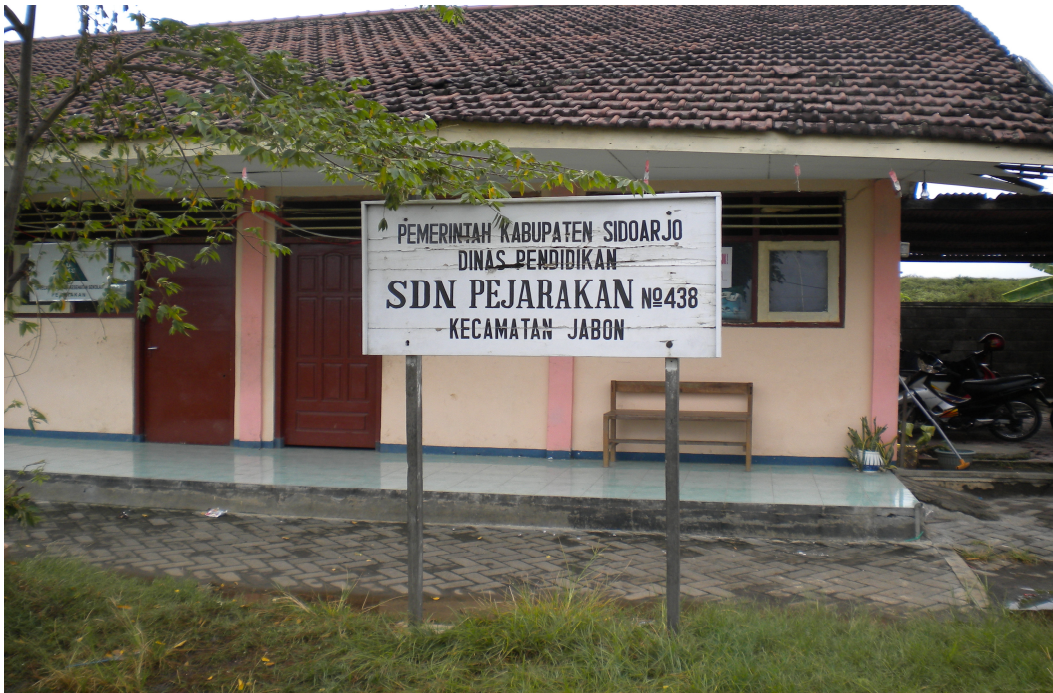
Gambar SD Negeri Pejarakan dari Depan