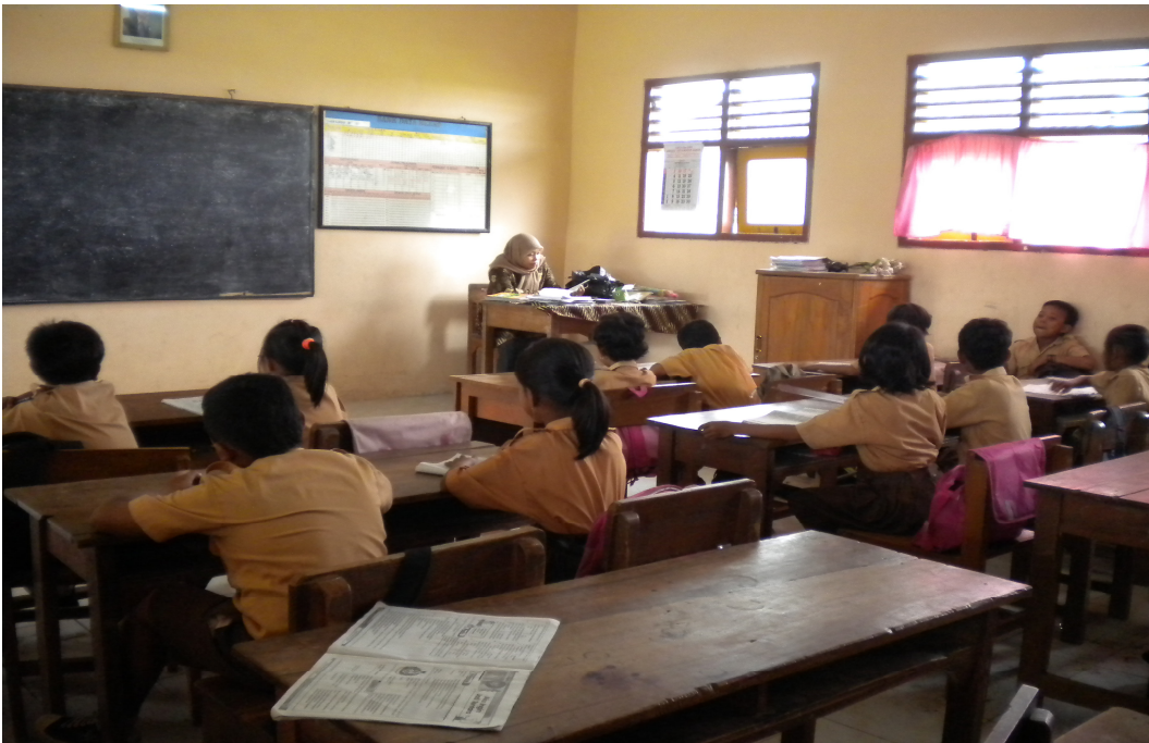
Gambar Proses Pembelajaran di Kelas