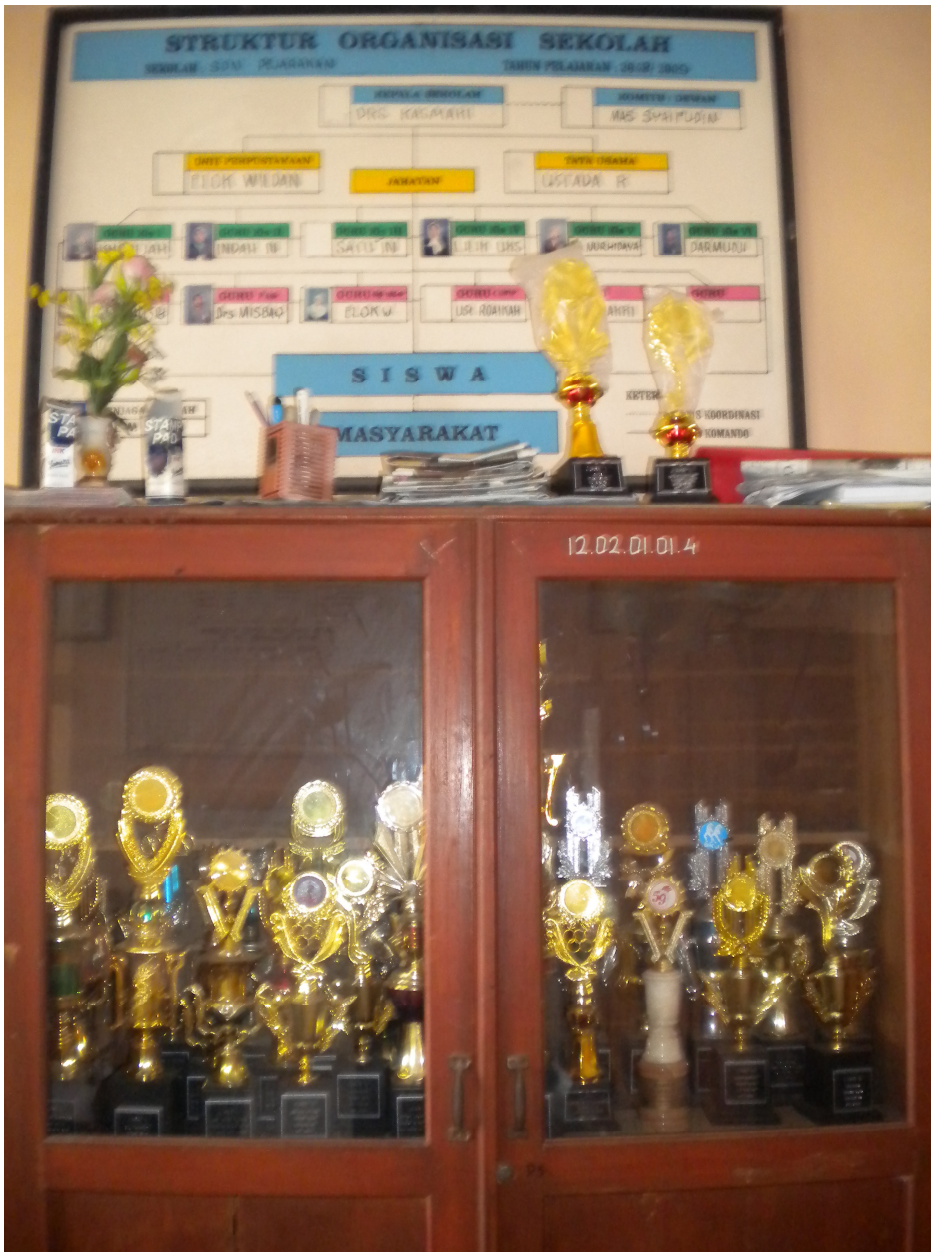
Gambar Trophy yang di dapat SD Negeri Pejarakan