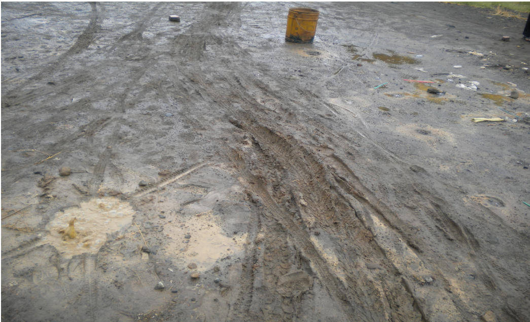
Gambar Kondisi Halaman Sekolah