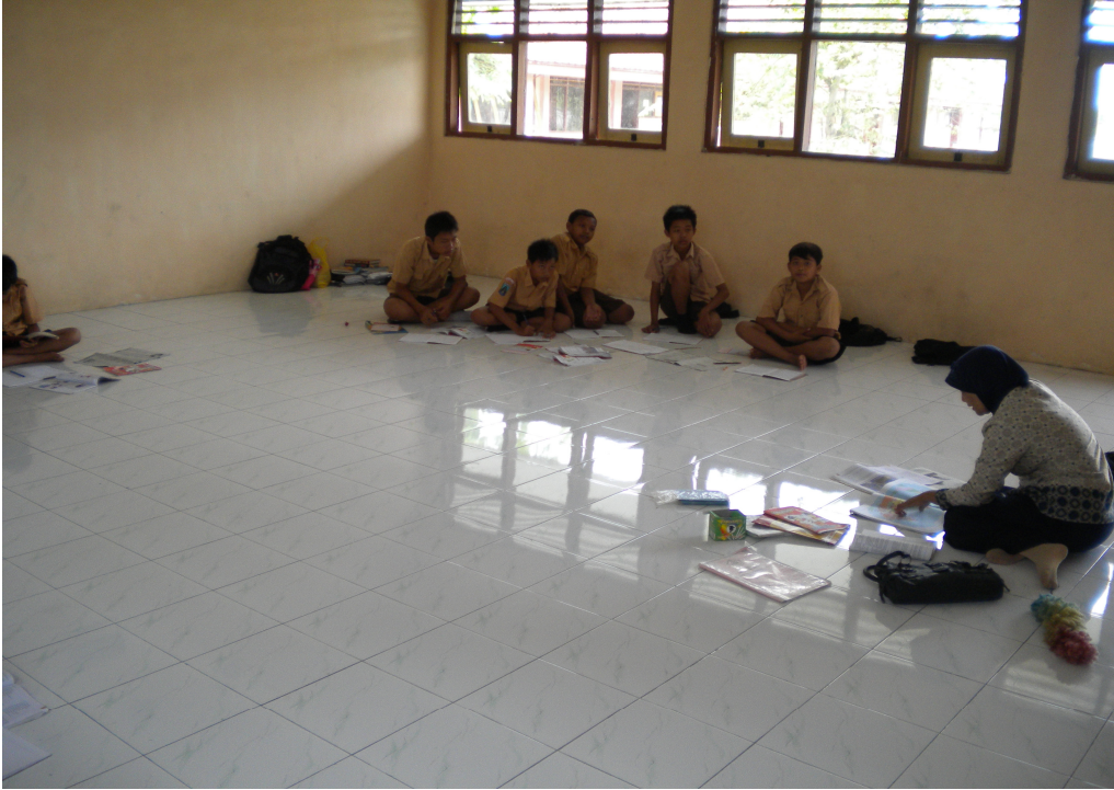
Gambar Proses Pembelajaran di Musholla