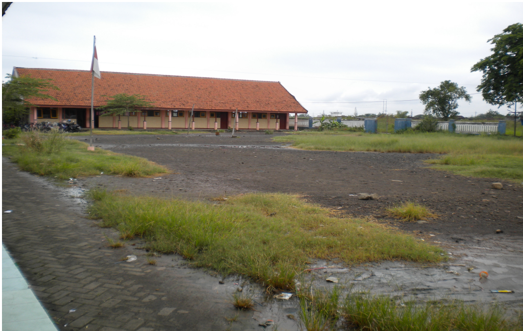
Gambar SD Negeri Pejarakan dari Samping