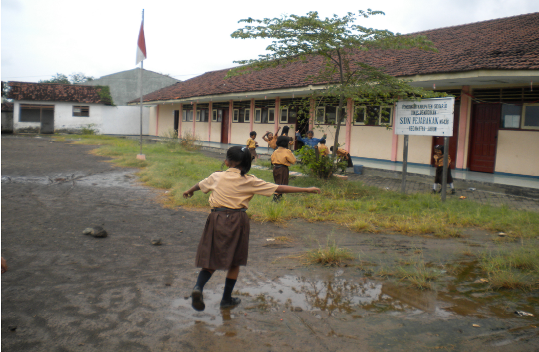
Gambar Kondisi Siswa Saat Istirahat Berlangsung