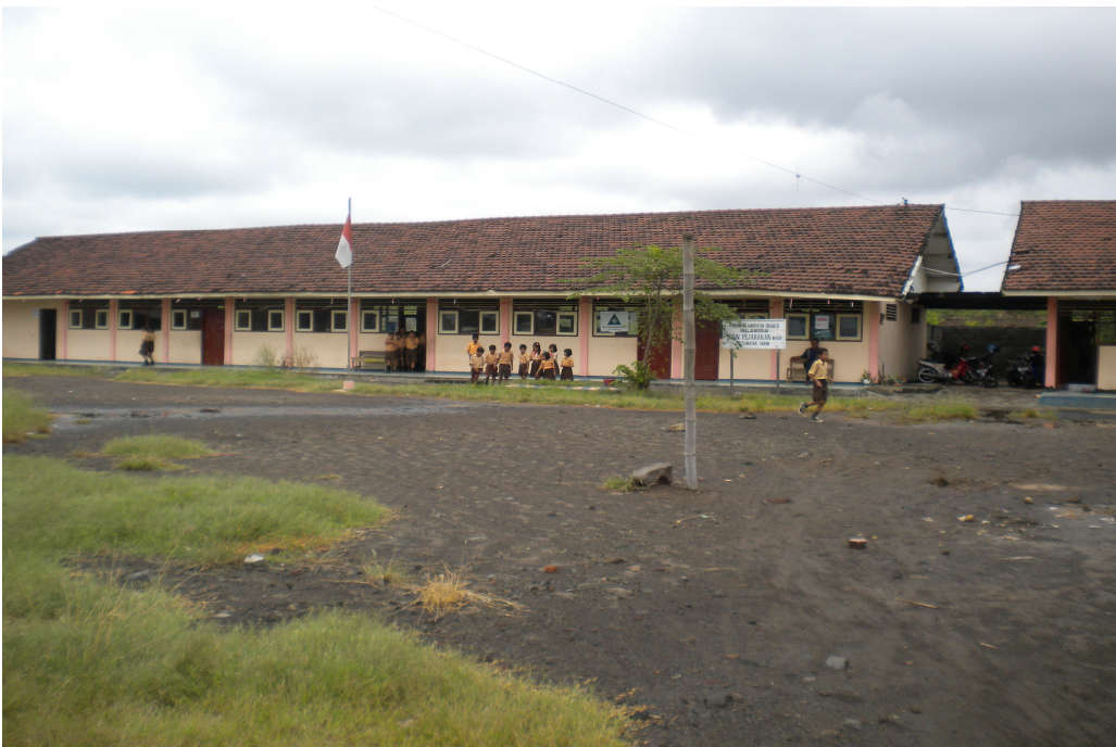
Gambar Kondisi Halaman Sekolah