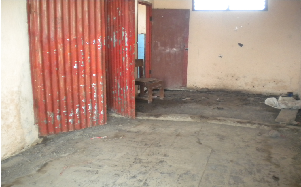
Gambar Kondisi Kamar Mandi Sekolah