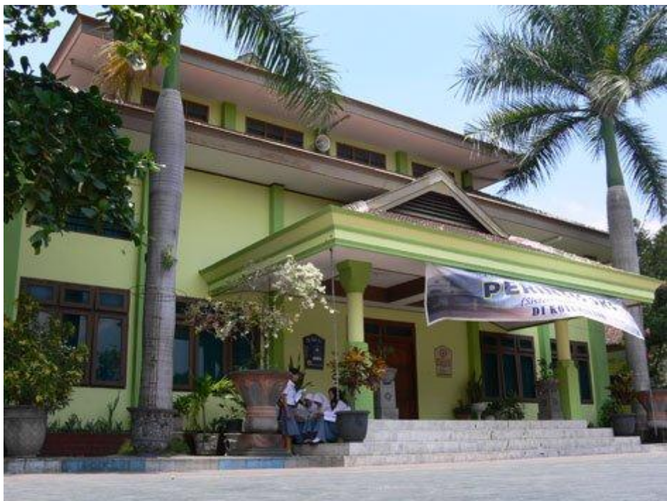
Gambar IV : Aula SMA Negeri 2 Malang