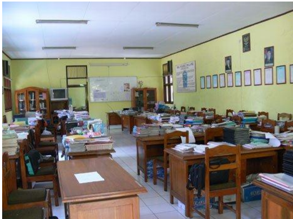
Gambar II : Ruang Guru SMA Negeri 2 Malang