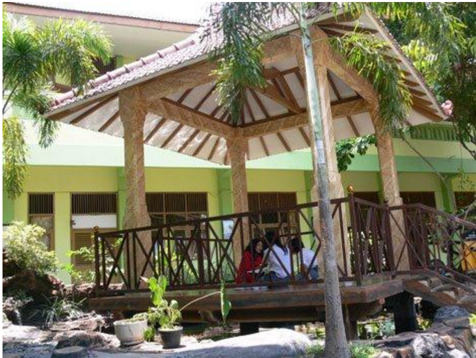
Gambar III : Tempat Belajar Siswa SMA Negeri 2 Malang