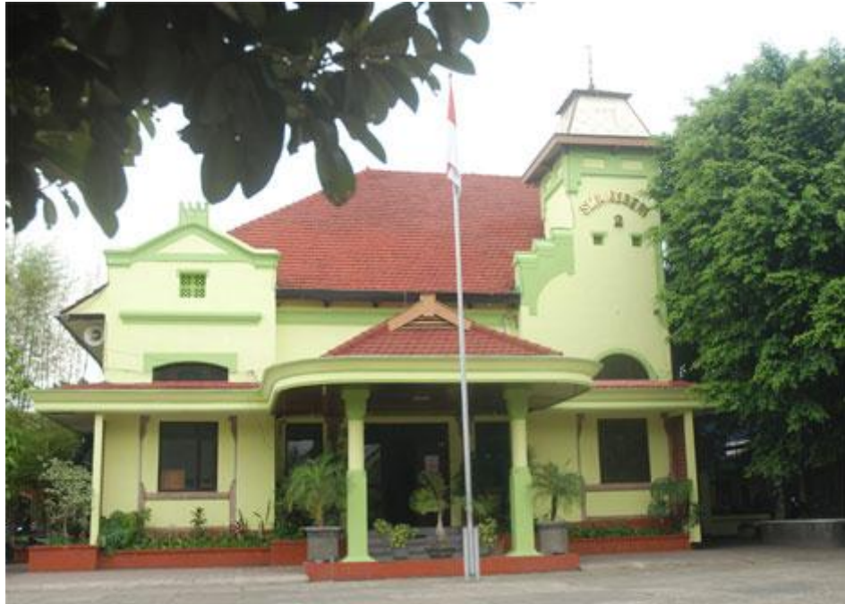
Gambar I : Gedung SMA Negeri 2 Malang