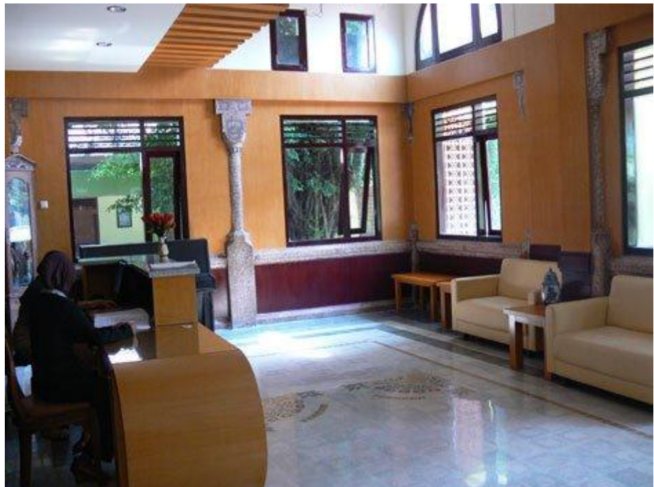
Gambar VI : Lobi SMA Negeri 2 Malang