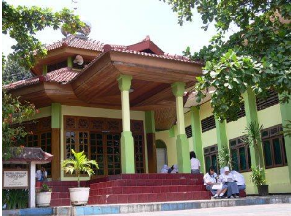
Gambar V : Musholla SMA Negeri 2 Malang