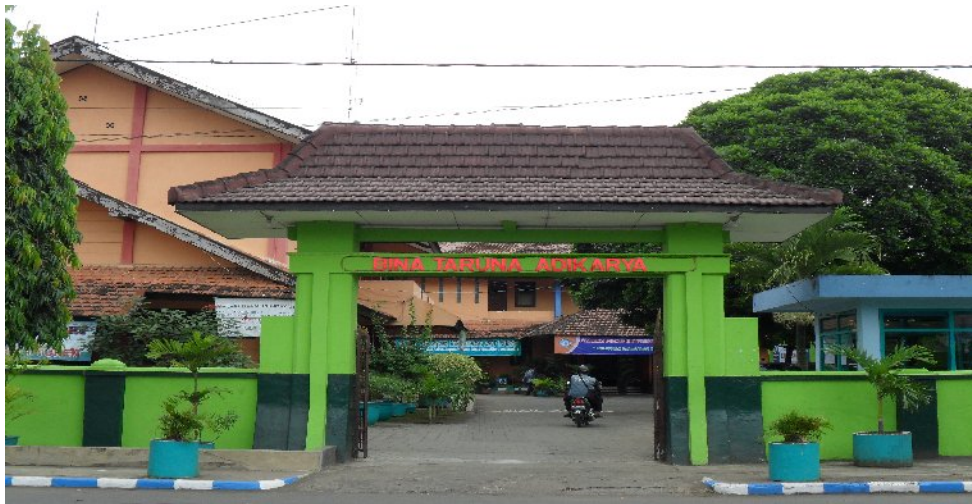
Pintu Masuk SMK Negeri 1 Turen