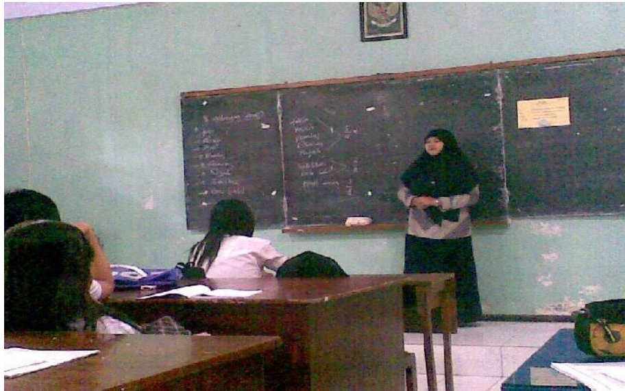
Suasana Belajar di kelas