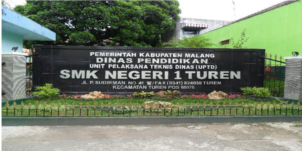
Depan Sekolah SMK Negeri 1 Turen