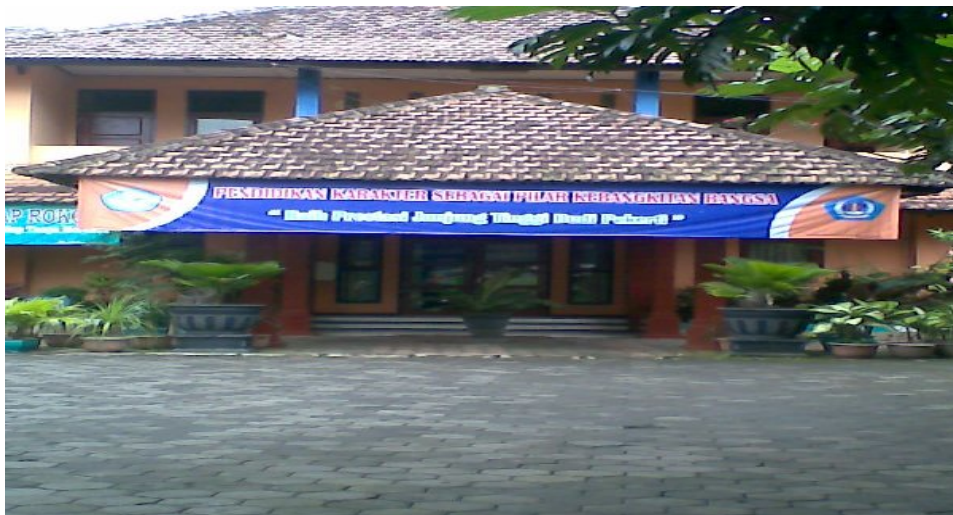
Gedung Utama SMK Negeri 1 Turen