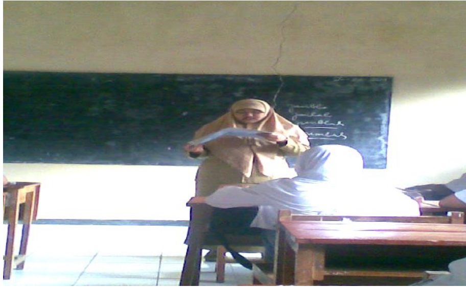
Suasana Belajar di kelas