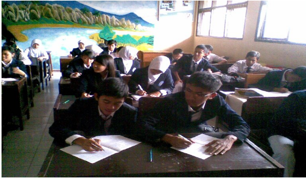
Suasana belajar di kelas