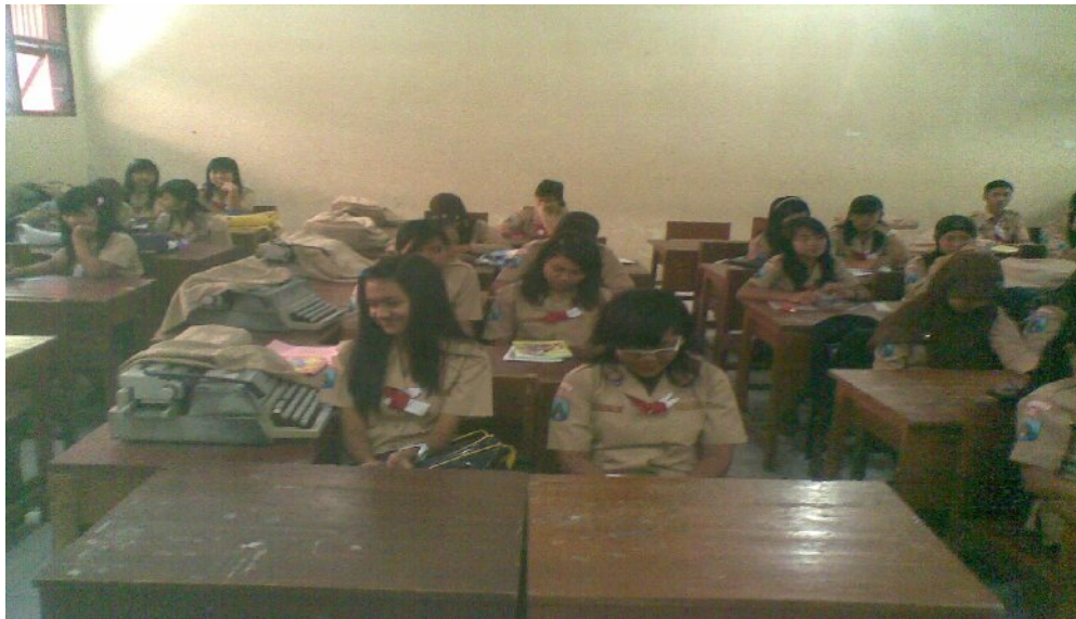
Suasana belajar di kelas