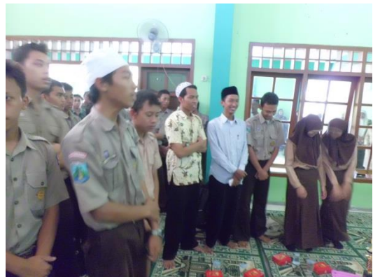
Peringatan maulid Nabi