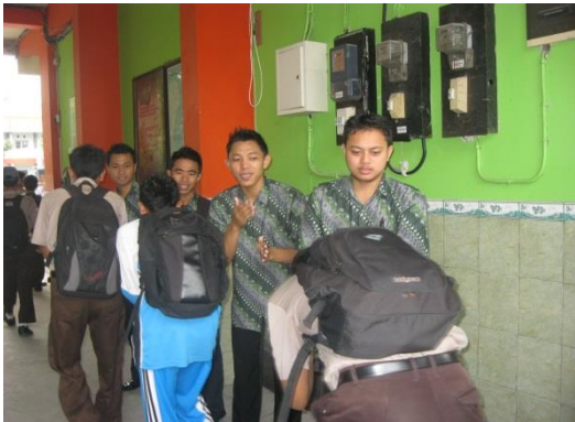
Kegiatan penyambutan pagi sebelum masuk kelas