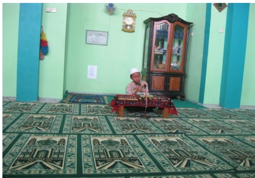
Pembacaan tilawah Al-Qur'an