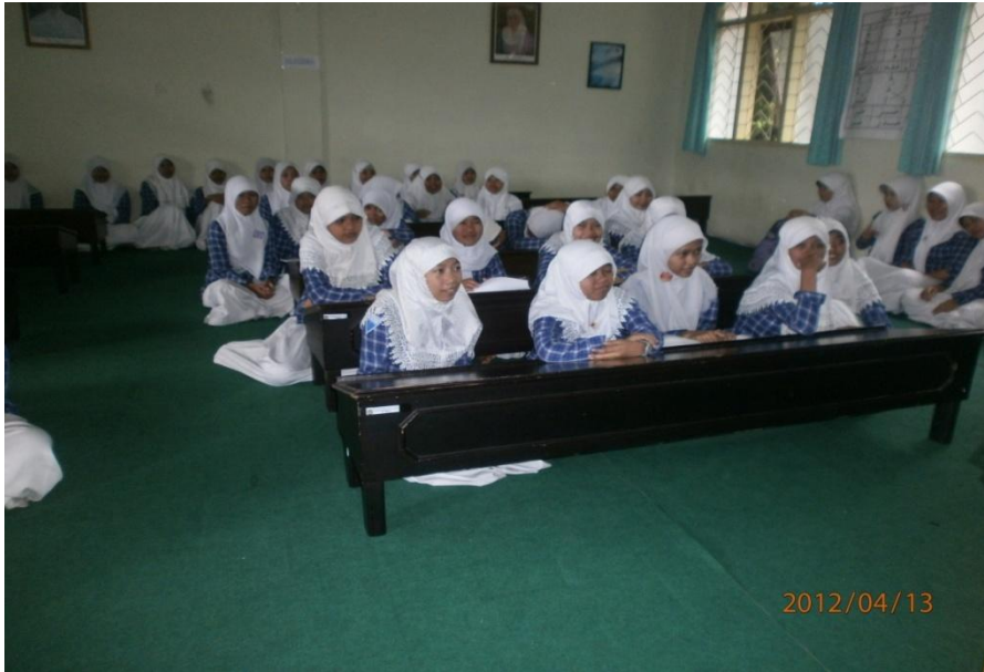
Keterangan: Kegiatan Keagamaan Keputrian SMK Muhammadiyah 2 Malang