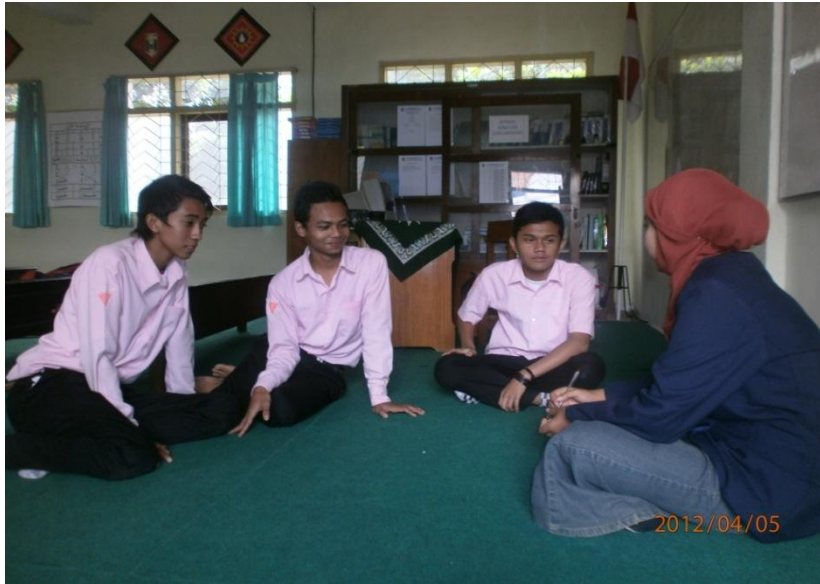
Keterangan: Wawancara peneliti dengan siswa SMK Muhammadiyah 2 Malang