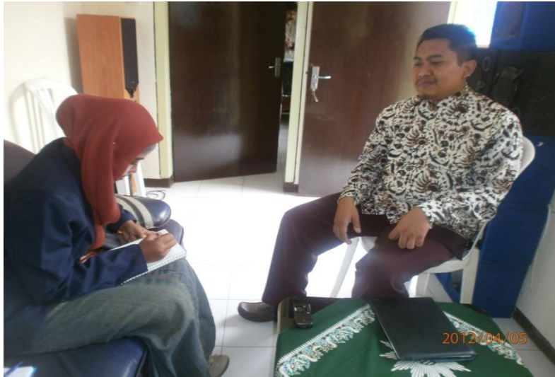
Keterangan: Wawancara peneliti dengan Waka Keagamaan SMK Muhammadiyah 2 Malang