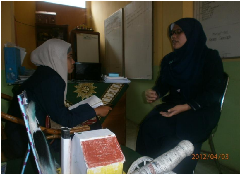
Keterangan: Wawancara peneliti dengan guru Bimbingan dan Konseling SMK Muhammadiyah 2 Malang