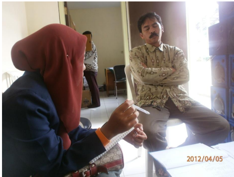
Keterangan: Wawancara peneliti dengan Waka Kesiswaan SMK Muhammadiyah 2 Malang