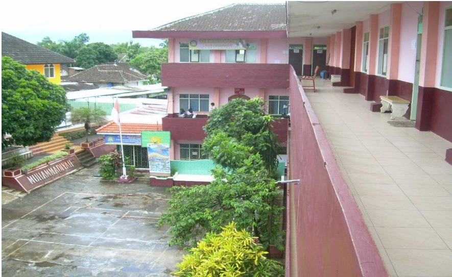
Keterangan: Gedung SMK Muhammadiyah 2 Malang