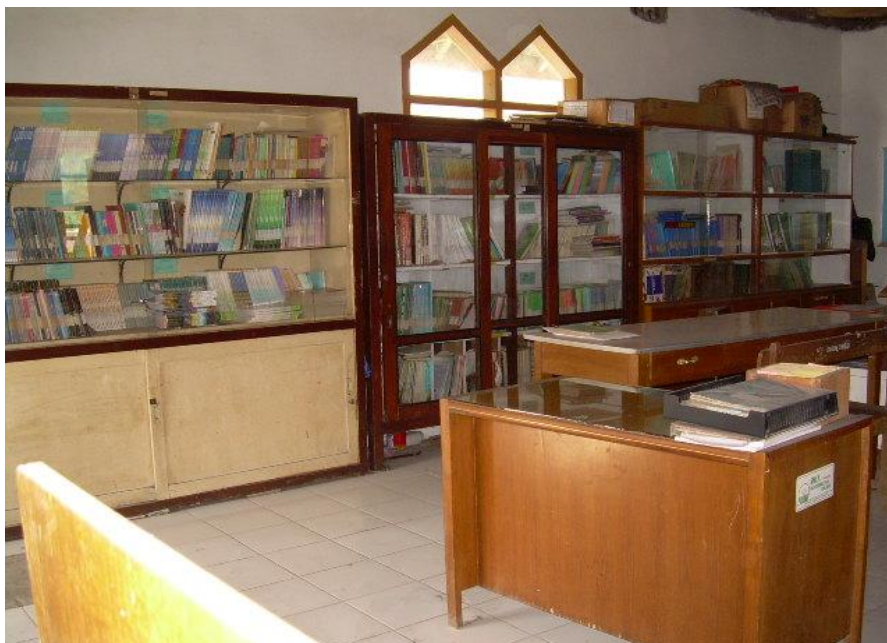
Keterangan: Ruang Perpustakaan SMK Muhammadiyah 2 Malang