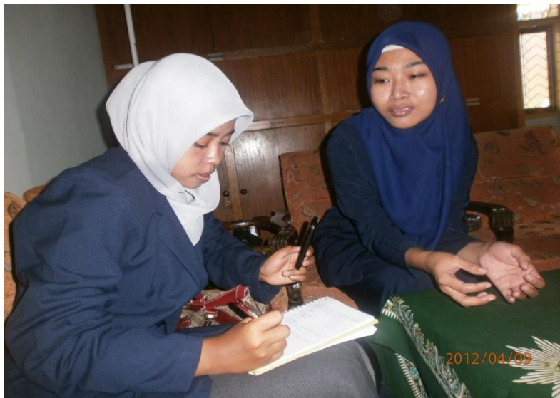
Keterangan: Wawancara peneliti dengan guru Pendidikan Agama Islam SMK Muhammadiyah 2 Malang