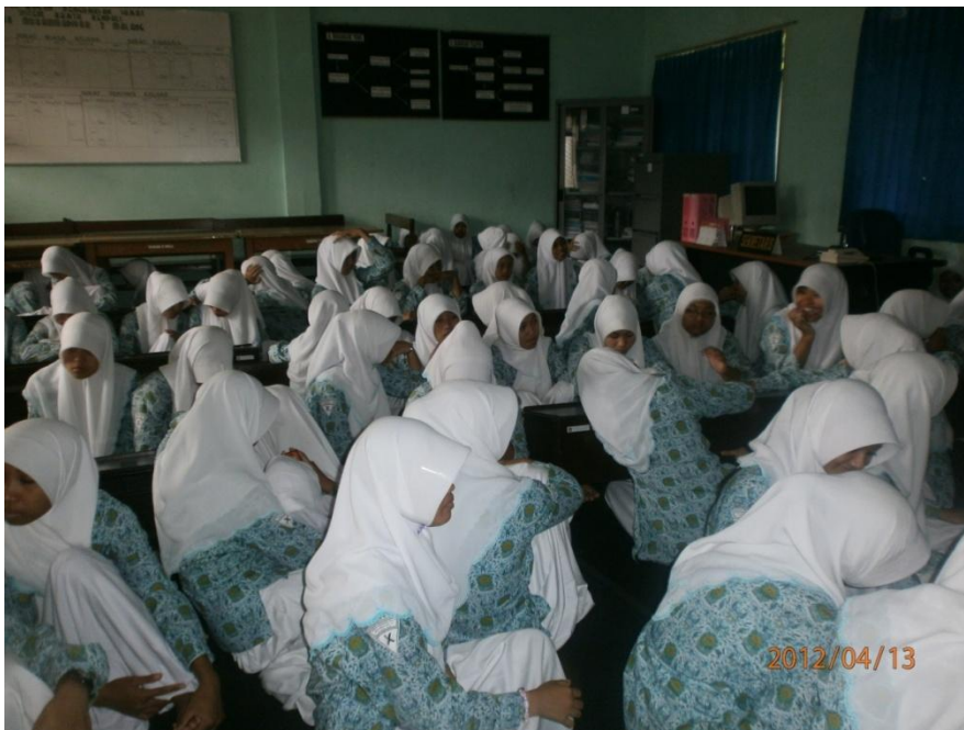
Keterangan: Kegiatan keagamaan ke Muhammadiyah SMK Muhammadiyah 2 Malang