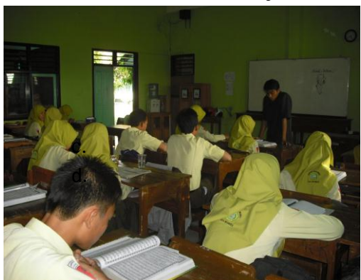
Gambar 5: Proses pembelajaran tilawah Al-Qur'an