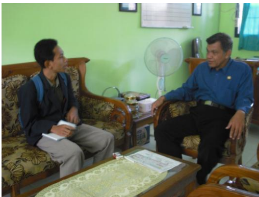
Gambar 1: wawancara dengan kepala madrasah