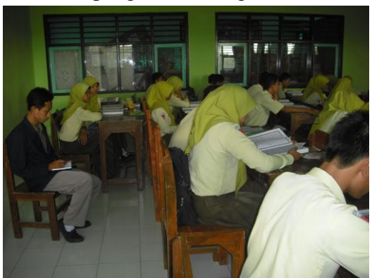
Gambar 6: Pengamatan langsung proses pembelajaran Tilawah Al-Qur'an kelas XI IPA 2