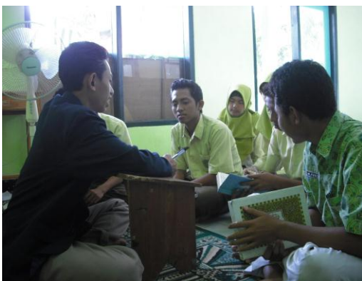
Gambar 3: wawancara dengan siswa-siswi kelas XI IPA 2 MAN 1 Kota Mojokerto