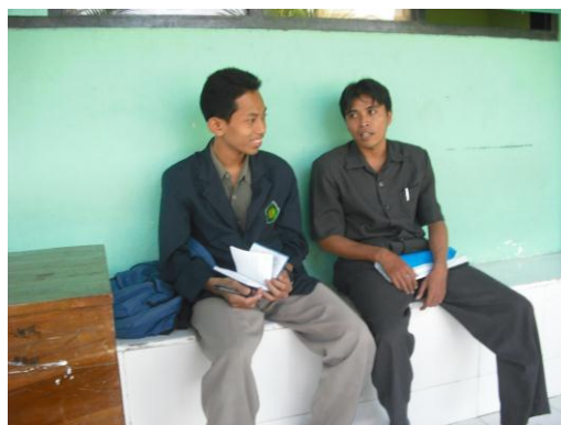
Gambar 2: wawancara dengan guru mapel Tilawah Al-Qur'an