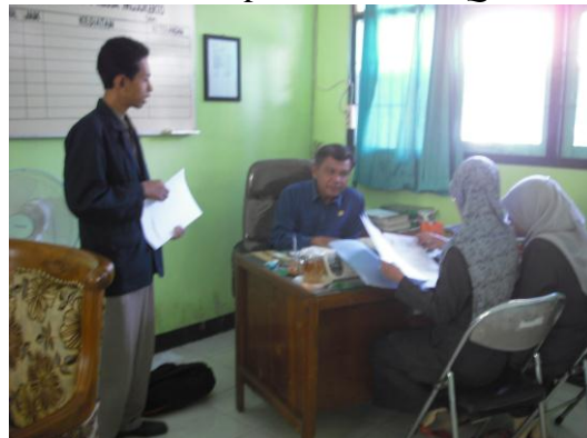
Gambar 4: Wawancara dengan kepala madrasah serta para jajaran pengurus lembaga madrasah