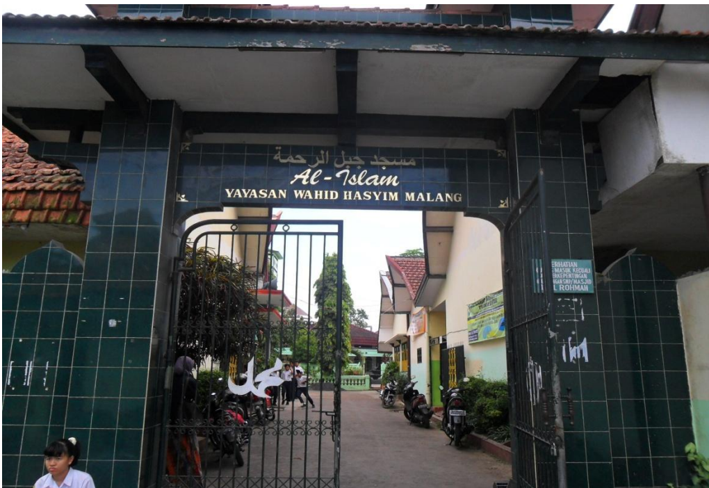
Gerbang SMP Wahid Hasyim Malang