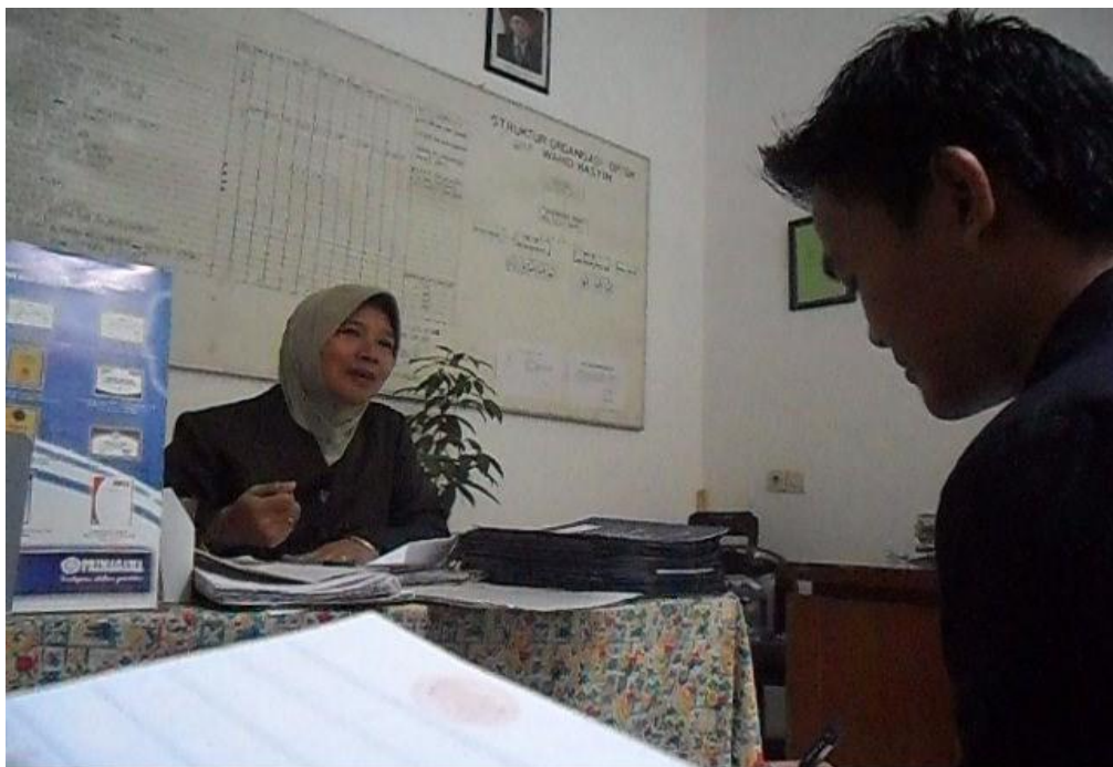
Wawancara bersama Guru PAI SMP Wahid Hasyim Malang