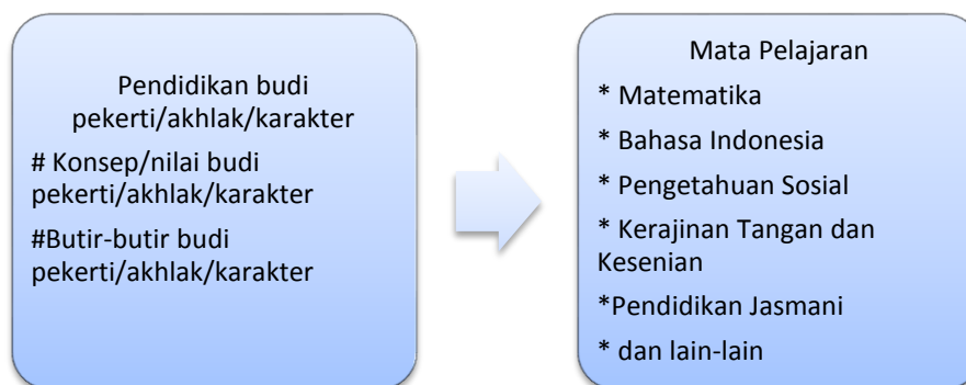
Gambar 2.2 Kerangka Pengintegrasian Budi Pekerti/Akhlak/karakter

Pendekatan pelaksanaan pendidikan karakter sebaiknya dilakukan secara terintegrasi dan terinternalisasi ke dalam seluruh kehidupan sekolah. Terintegrasi, karena pendidikan karakter memang tidak dapat dipisahkan dengan aspek lain dan merupakan landasan dari seluruh aspek termasuk seluruh mata pelajaran. Terinternalisasi, karena pendidikan karakter harus mewarnai seluruh aspek kehidupan. 26