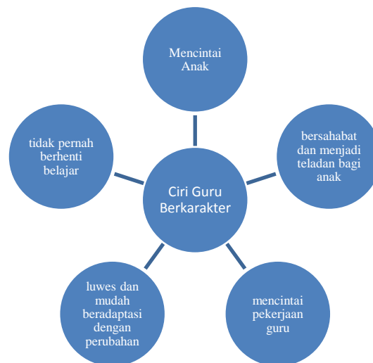
Gambar 2.1 Ciri guru Berkarakter

Apabila ciri-ciri tersebut dimiliki oleh guru alih-alih disebut sebagai guru yang berkarakter, tentu keresahan di dunia pendidikan tidak akan terjadi. 7