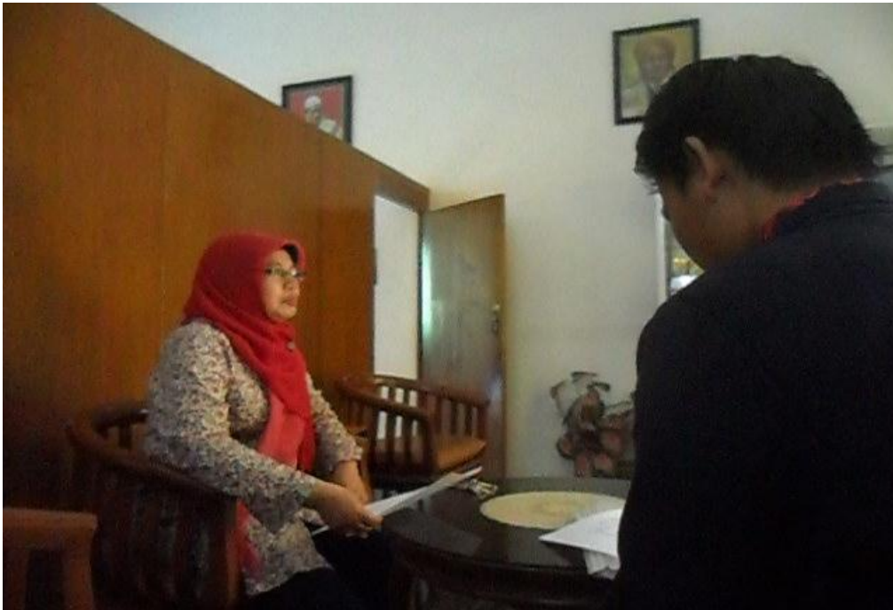
Wawancara bersama Kepala SMP Wahid Hasyim Malang