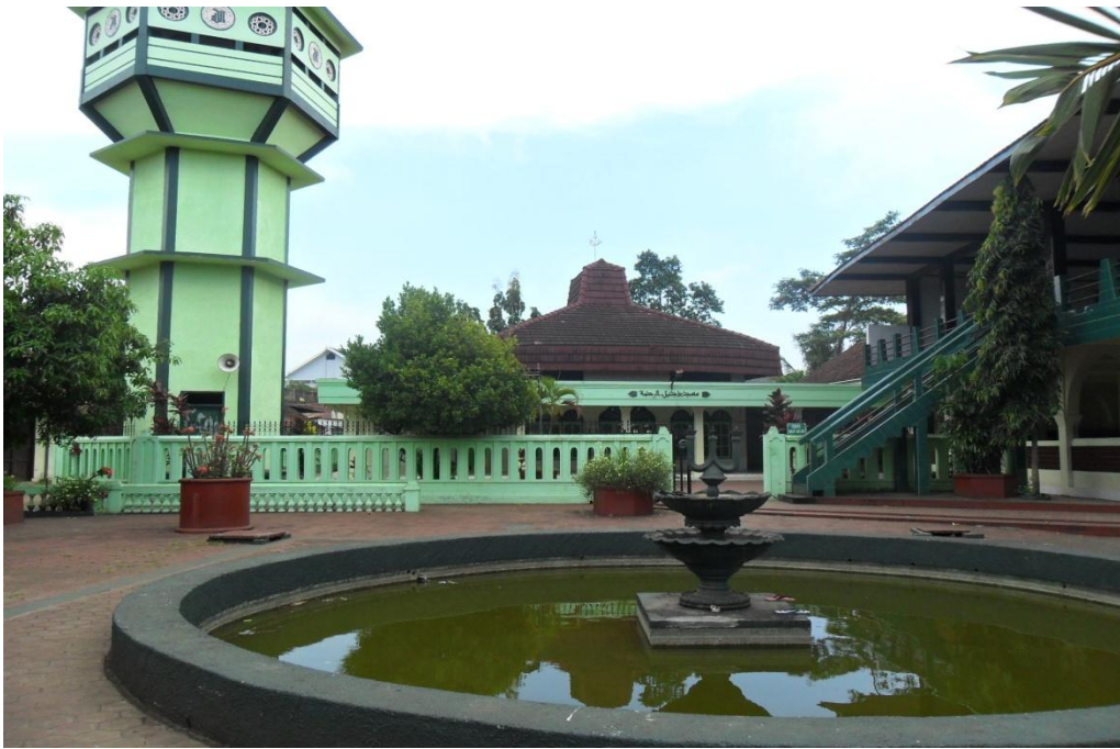
Masjid SMP Wahid Hasyim Malang