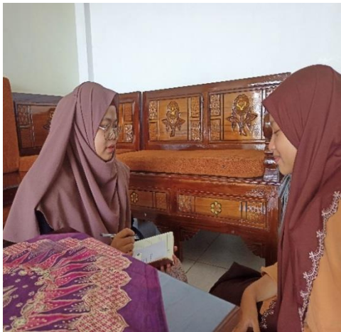
Wawancara peneliti dengan siswa