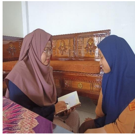
Wawancara peneliti dengan siswa