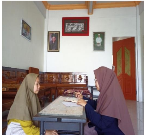
Wawancara peneliti dengan siswa