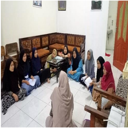
Implementasi media buku saku