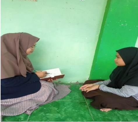
Wawancara peneliti dengan siswa