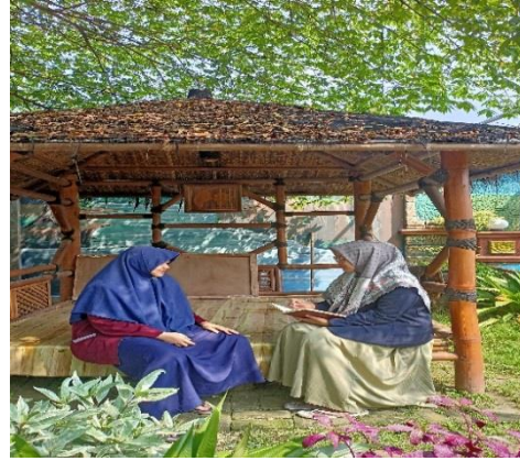
Wawancara peneliti dengan guru Bahasa Arab