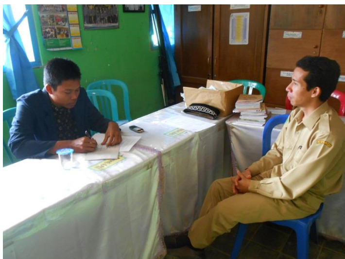
Wawancara Dengan Waka Kurikulum