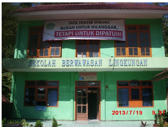
Madrasah Tampak Dari Depan