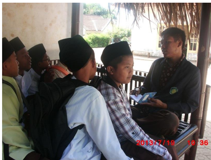
Wawancara Dengan Beberapa Siswa Kelas VII