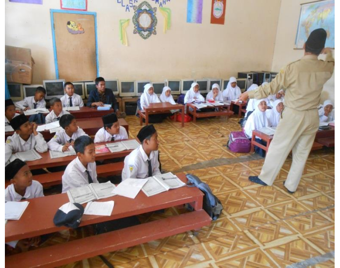
Proses Pembelajaran di Dalam Kelas