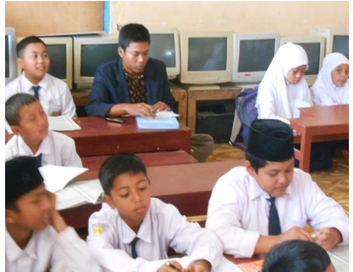
Peneliti Meneliti Strategi Guru di Dalam Kelas