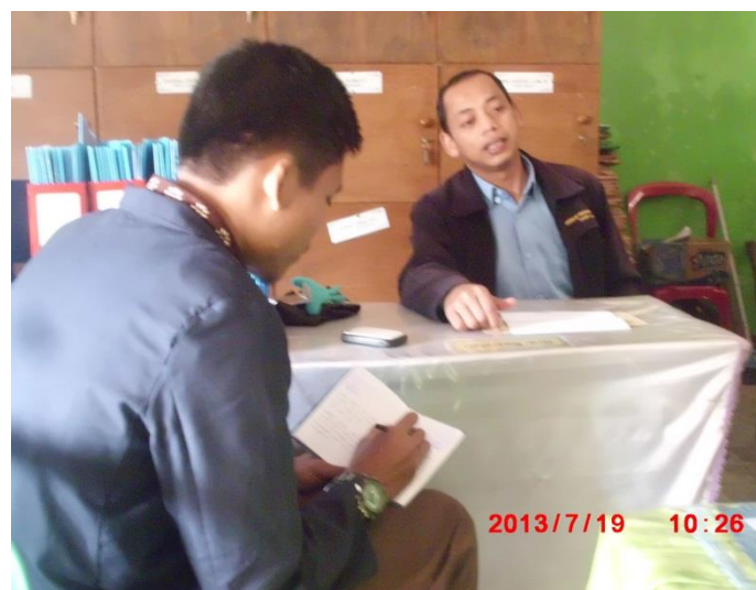
Wawancara Kepada Guru Al-Qur'an-Hadis