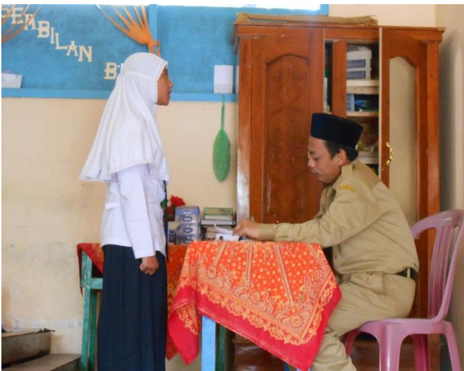
Siswa Hafalan Al-Qur'an-Hadis