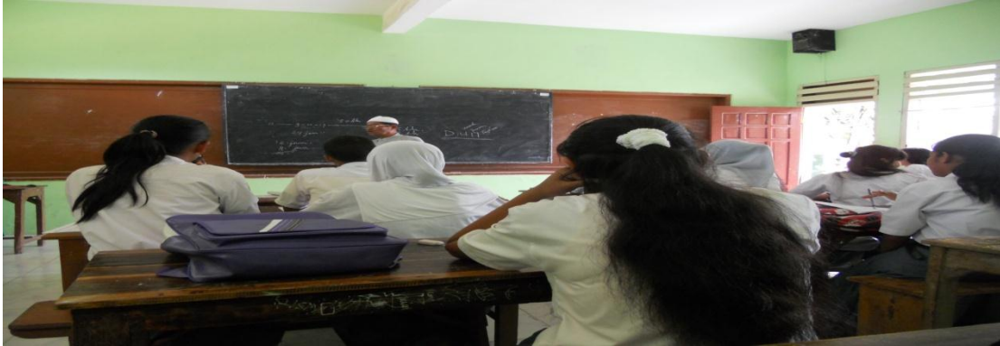
Proses pembelajaran sebelum menggunakan media CD Pembelajaran