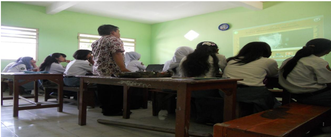
Proses pembelajaran menggunakan media CD Pembelajaran