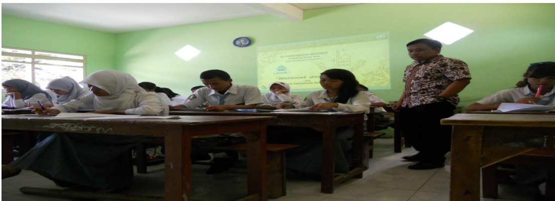
Siswa ketika mengerjakan soal evaluasi