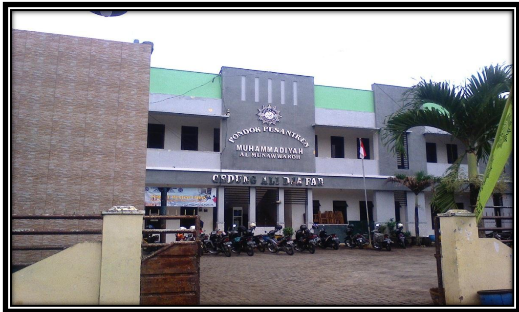
Gedung Sekolah Tampak Depan