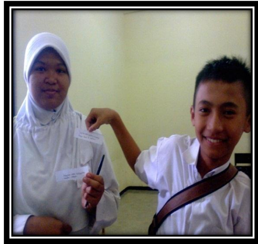
Penerapan Metode Make A Match