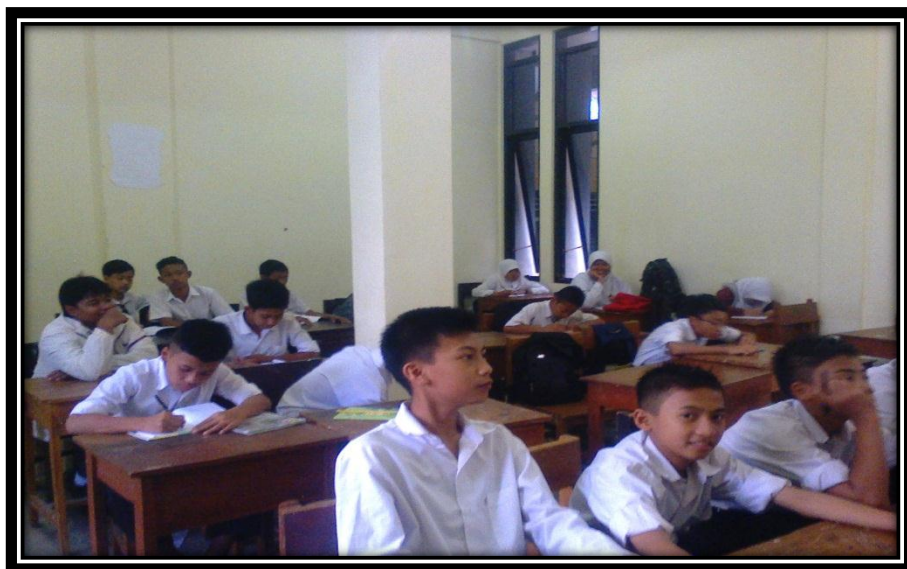
Kegiatan Belajar Mengajar