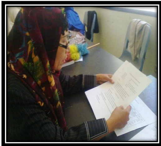
Konsultasi dengan guru mata pelajaran