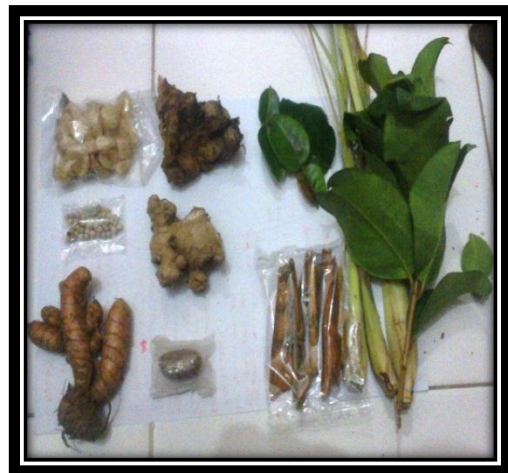
Alat bantu proses pembelajaran