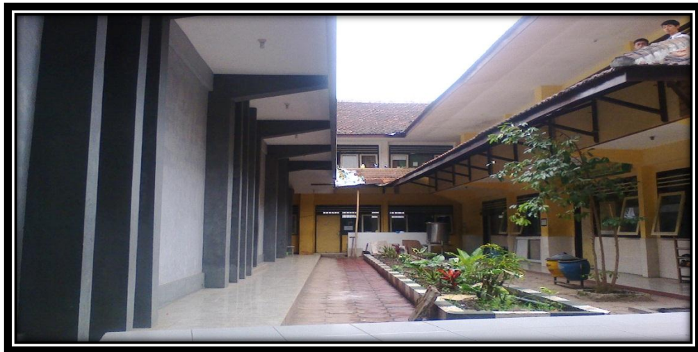
Ruang Kelas MTs Muhammadiyah 2 Malang