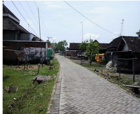
Foto 1.8: Lokasi penelitian Desa Talunrejo Kecamatan Bluluk kabupaten Lamongan