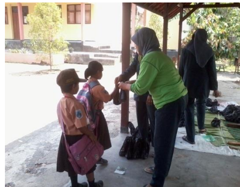
Gambar 9. Perayaan hari raya Qurban