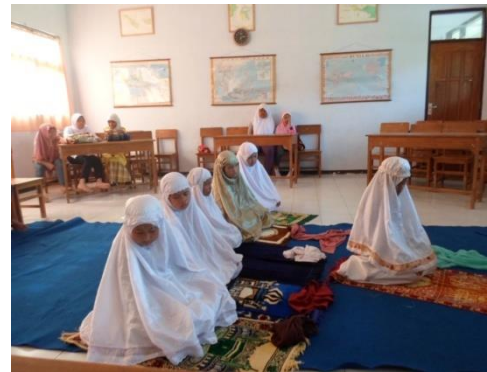
Gambar 5. Kegiatan praktek ibadah sholat