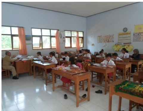
Gambar 4. Guru PAI menyampaikan materi di kelas IV