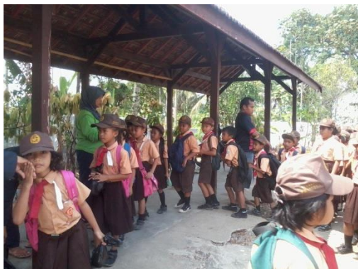
Gambar 14. Siswa terbiasa bersalaman dengan guru