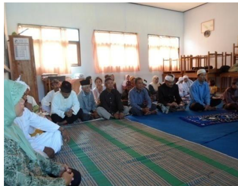
Gambar 11. Doa bersama menyambut UN