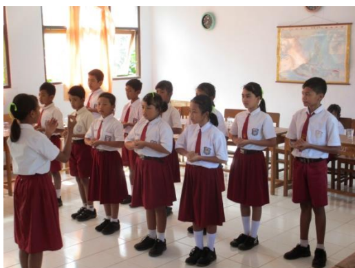
Gambar 12. Kegiatan ibadah siswa yang beragama Kristen