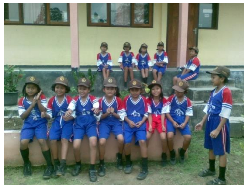
Gambar 15. Semua siswa saling menghargai dan bersikap baik