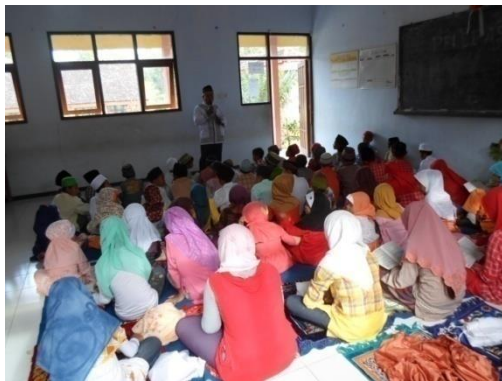
Gambar 10. Peringatan maulud Nabi Muhammad