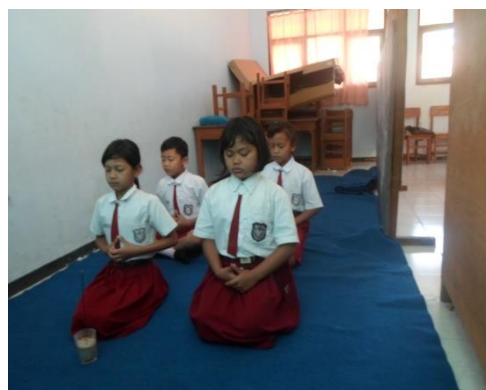
Gambar 13. Kegiatan ibadah siswa yang beragama Hindu