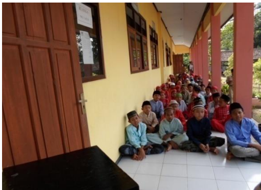
Gambar 8. Peringatan isro' mi'roj di sekolah