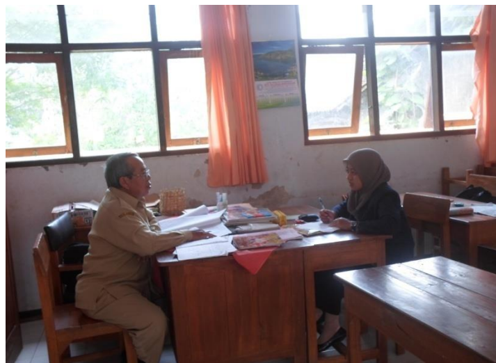
Gambar 2. Wawancara dengan guru PAI SDN Mlancu 3 Kediri