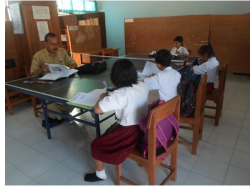
Gambar 7. Guru menyampaikan materi