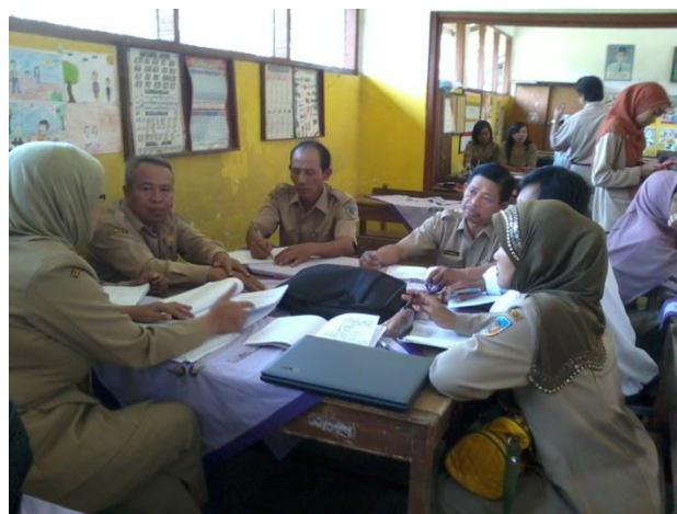
Gambar 16. Semua guru saling menghormati dan saling bekerja sama