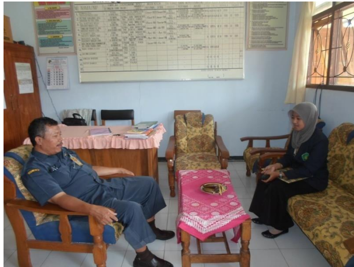
Gambar 1. Wawancara dengan kepala sekolah SDN Mlancu 3 Kediri