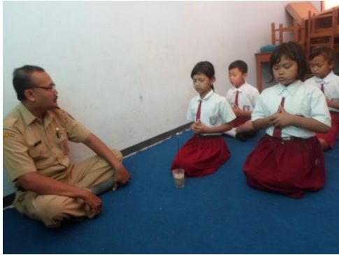
Gambar 6. Sembahyang (berdoa) bersama sebelum pembelajaran di mulai