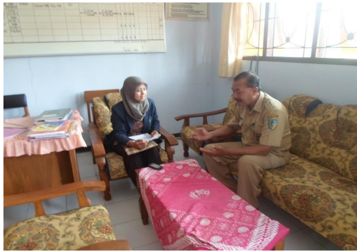
Gambar 3. Wawancara dengan guru agama Hindu SDN Mlancu 3 Kediri