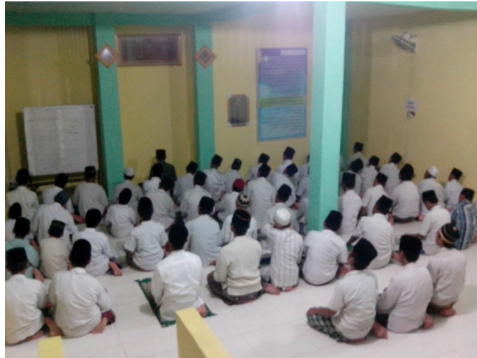
Gambar 07. Kegiatan sholat berjama'ah santri putra