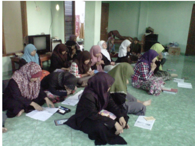
Gambar 08. Kegiatan Diniyyah santri putri