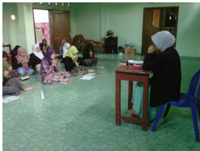
Gambar 09. Kegiatan Diniyyah santri putr