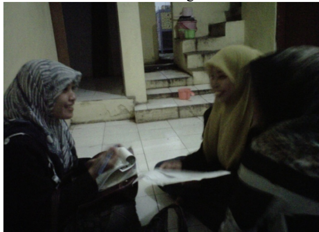
Gambar 11. Wawancara dengan santri sekaligus pengurus pondok al-Ghozali Tambakberas Jombang