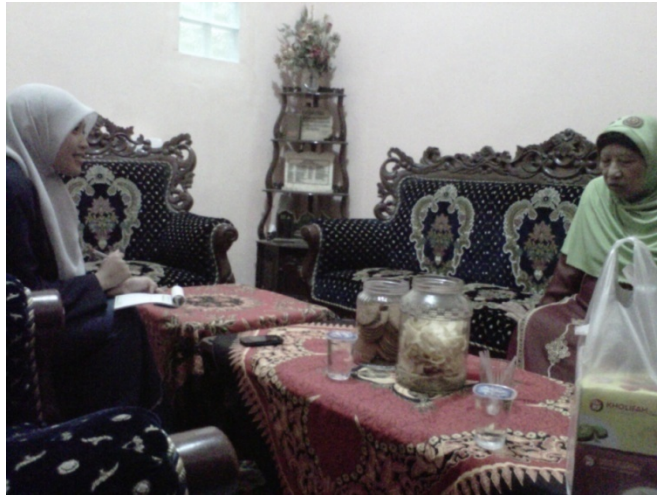
Gambar 10. Wawancara dengan Pengasuh pondok al-Ghozali Tambakberas Jombang