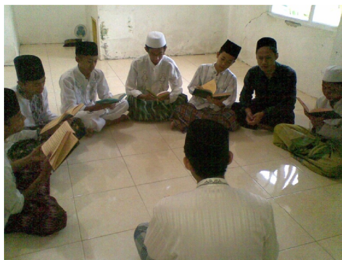
Gambar 06. Kegiatan Diniyyah santri putra