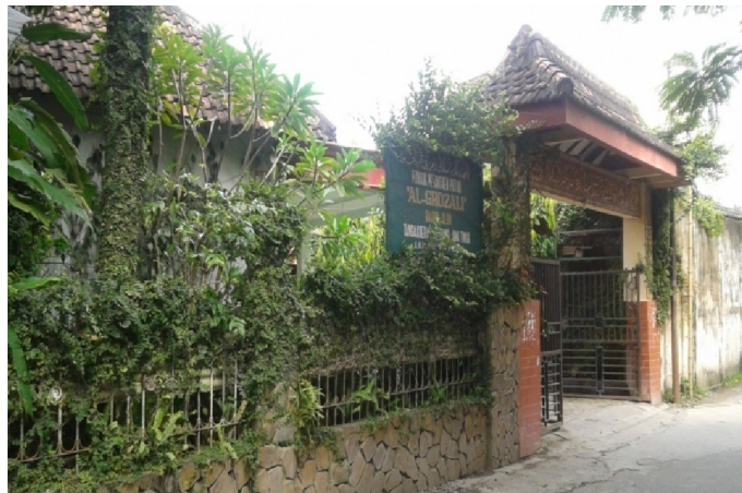
Gambar 02. Gerbang pondok pesantren al-Ghozali