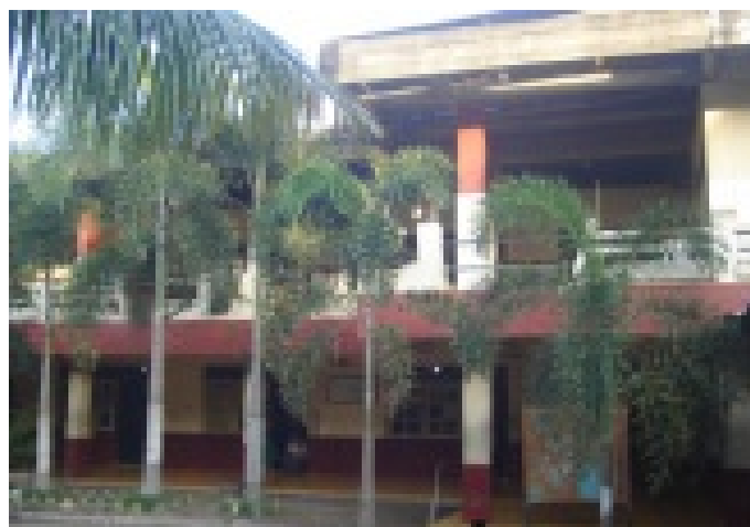
Gambar 03. Gedung pondok pesantren al-Ghozali