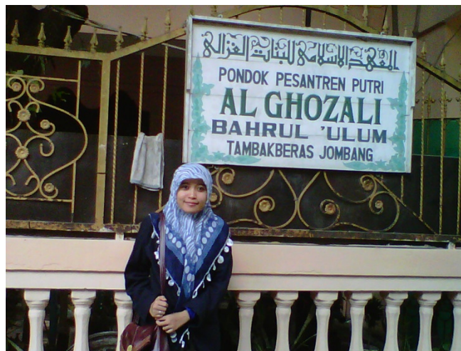
Gambar 12. Peneliti di depan pondok al-Ghozali Tambakberas Jombang