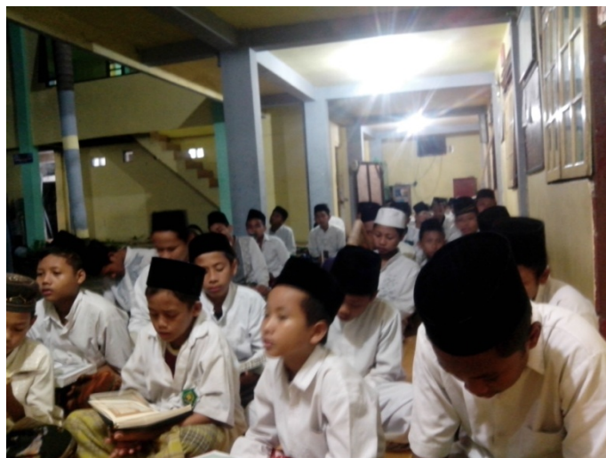
Gambar 05. Kegiatan khotmil Qur'an santri putra