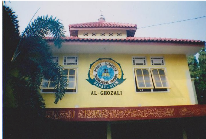
Gambar 04. Musholla pondok pesantren al-Ghozali