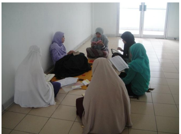
Suasana Tashih Qiro'ah Al-Qur'an