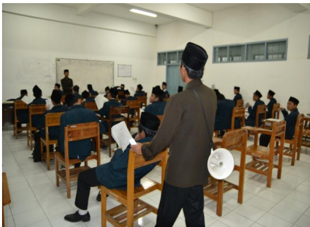
Suasana Ujian Akhir Semester Ganjil Ta'lim Al-Qur'an mahasantri putra MSAA