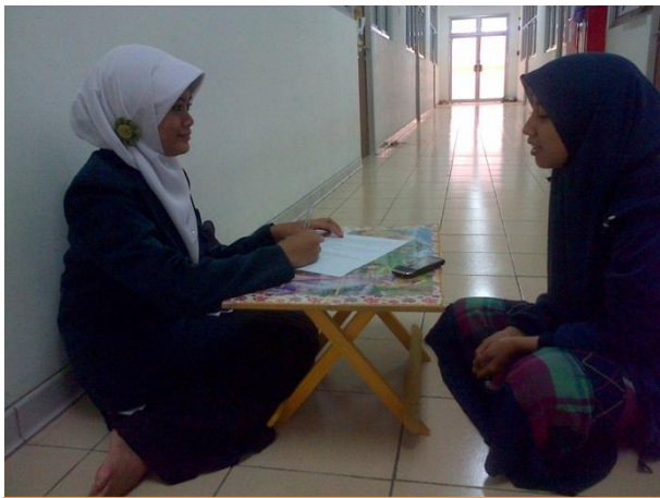
Wawancara dengan mahasantri kelas Tashwit