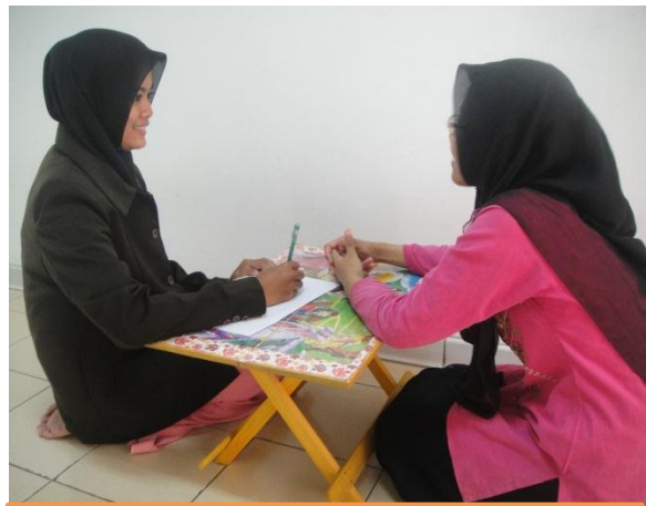
Wawancara dengan Mu'allimah