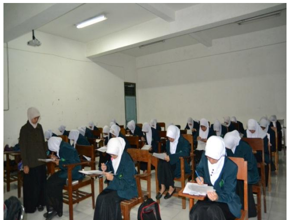
Suasana Ujian Akhir Semester Ganjil Ta'lim Al-Qur'an mahasantri putri MSAA