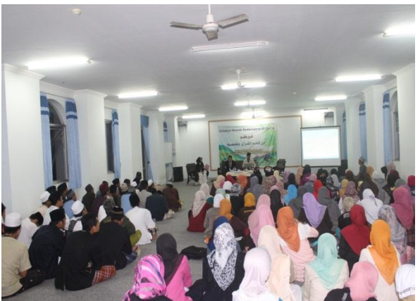
Seluruh Mu'allim/ah, Musyrif/ah dan Musohih/ah saat mengikuti pelatihan