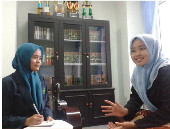
Wawancara dengan Murabbiah Divisi Ta'lim Al-Qur'an