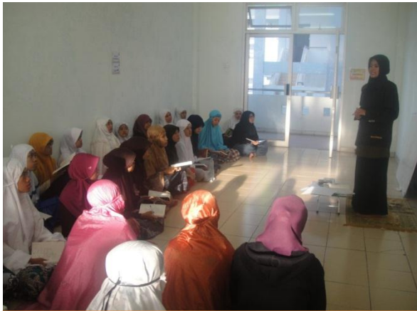
Suasana Pembelajaran Ta'lim Al-Qur'an