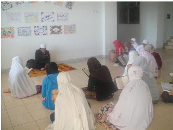
Suasana Tashih Qiro'ah Al-Qur'an