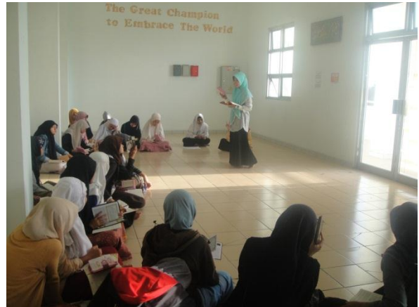
Suasana Pembelajaran Ta'lim Al-Qur'an