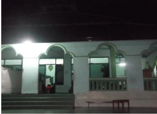
Gambar 1. Masjid Ponpes Sabilurrasyad tampak dari luar