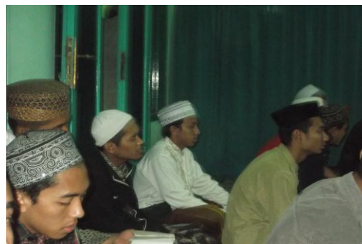
Gambar 6. Peneliti ketika mengikuti pembacaan Shalawat Nabi