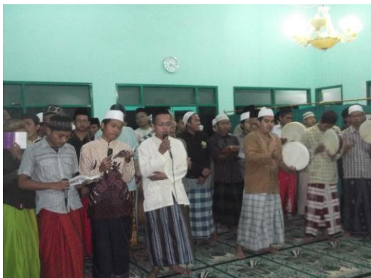
Gambar 3. Pembacaan Shalawat Nabi