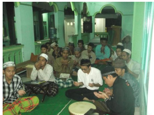
Gambar 4. Berdo'a bersama setelah selesai mengaji kitab Washaya