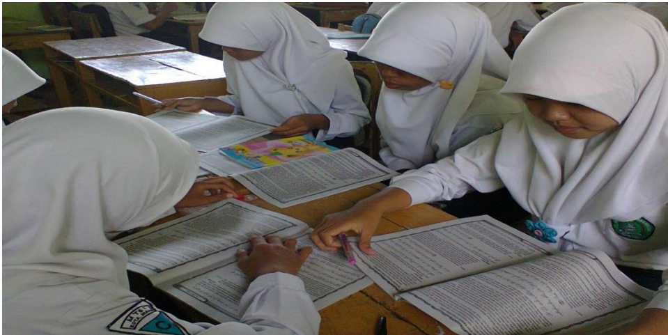
Gambar 8: Suasana saat diskusi dalam pembelajaran Aqidah Akhlak