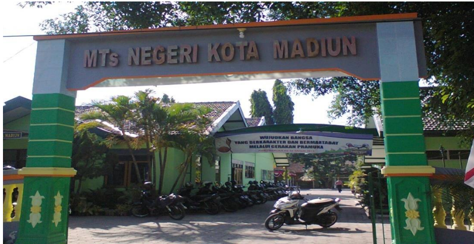
Gambar 1: MTsN Kota Madiun dari depan