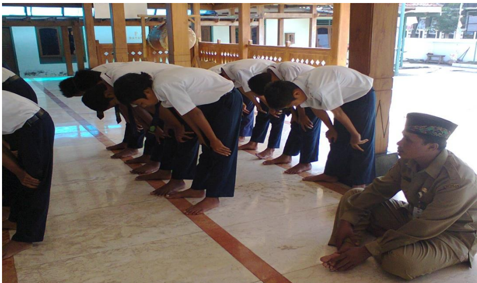
Gambar 9: Suasana bimbingan pelaksanaan shalat dhuha