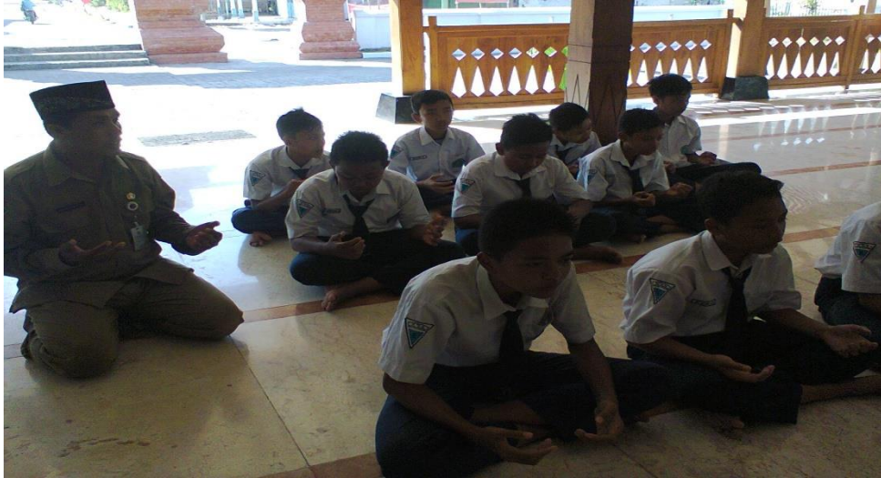
Gambar 10: Siswa diwajibkan untuk hafal bacaan setelah shalat dhuha