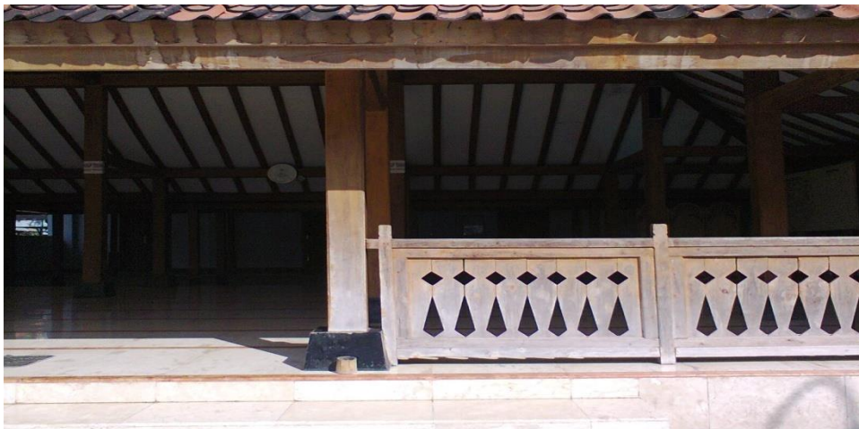
Gambar 4: Masjid tempat shalat siswa MTsN Kota Madiun