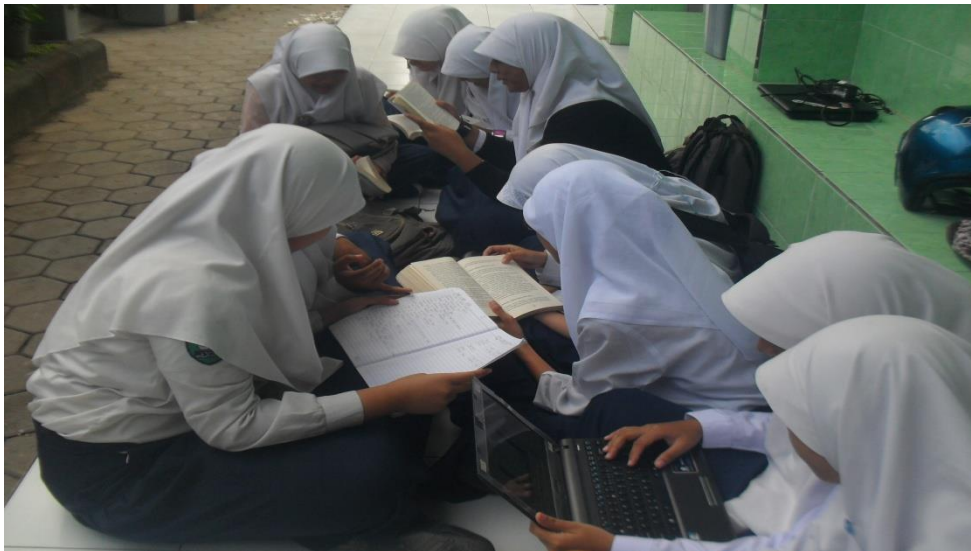
Gambar 11: siswa belajar mandiri di luar kelas saat jam kosong