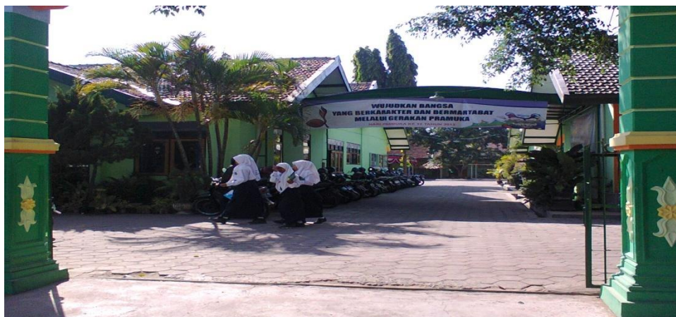
Gambar 2: MTsN Kota Madiun dari depan