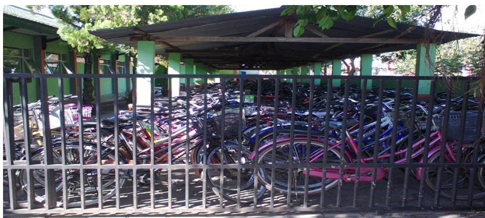
Gambar 3: Tempat parkir siswa MTsN Kota Madiun