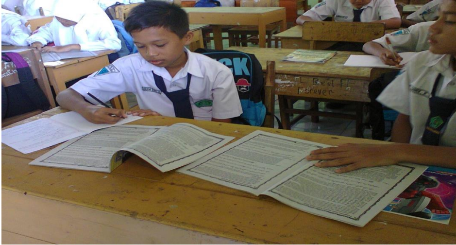
Gambar 7: Suasana saat pembelajaran Aqidah Akhlak