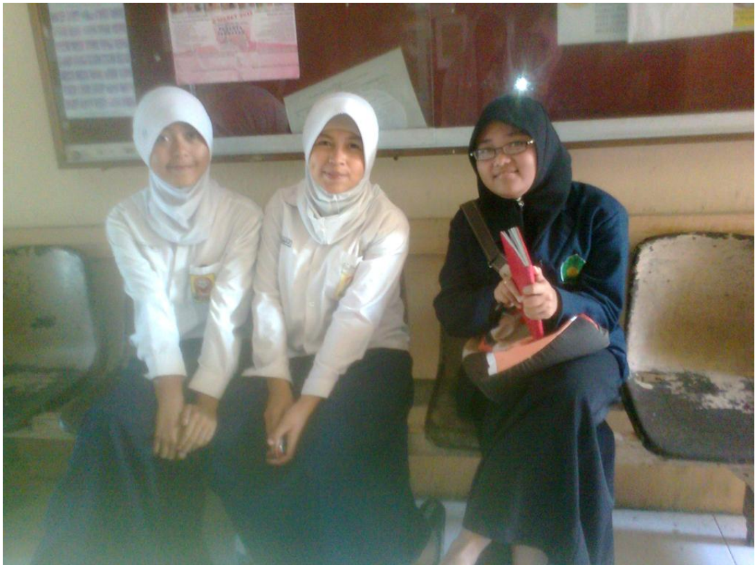
Seusai Wawancara dengan Siswa