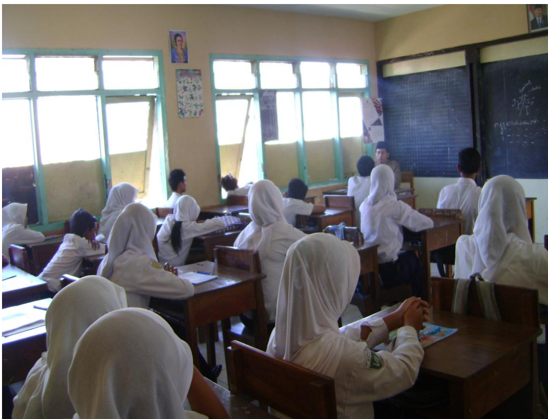
Suasana Pelaksanaan Kegiatan Ekstrakurikuler Keagamaan