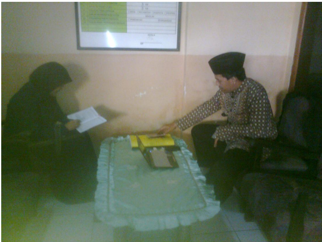
Wawancara dengan Pembina Kegiatan Ekstrakurikuler Keagamaan