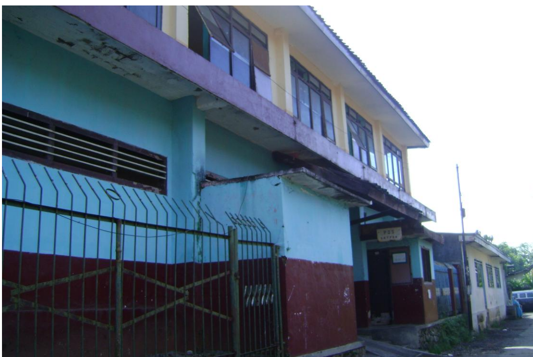
Sekolah Tampak dari Luar