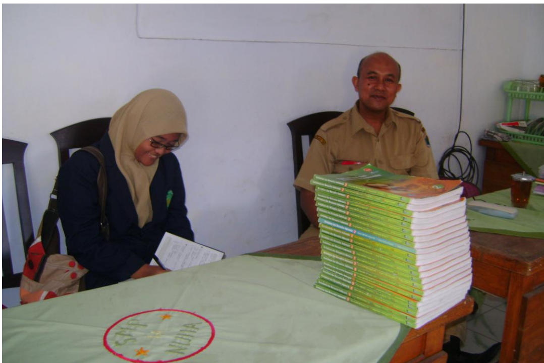
Wawancara dengan Waka Kesiswaan