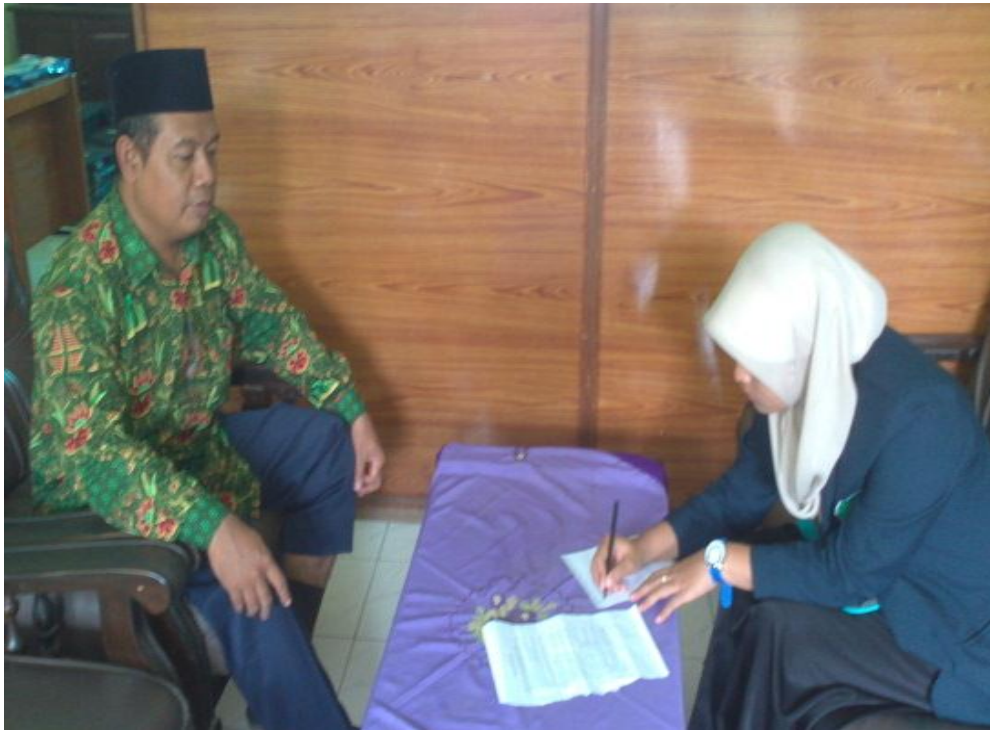
Wawancara dengan Guru Pendidikan Agama Islam