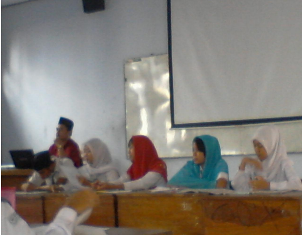
Wawancara dengan siswa