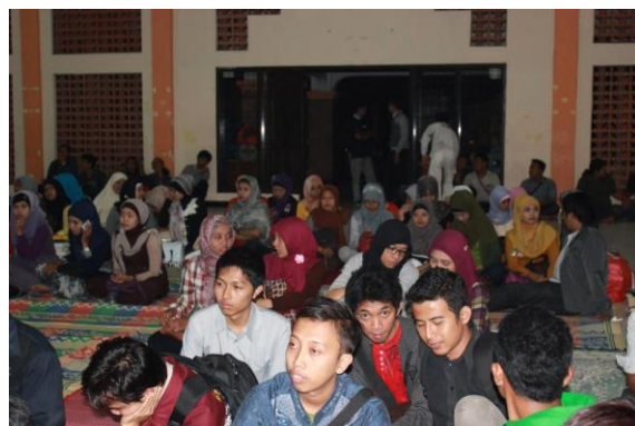
Acara pengajian rutin