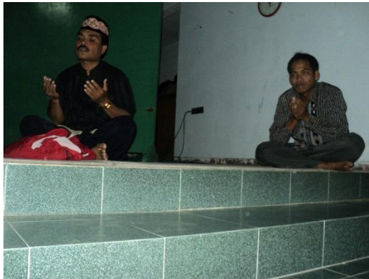
Mushallah MAN 1 Jember saat ada kegiatan pengajian