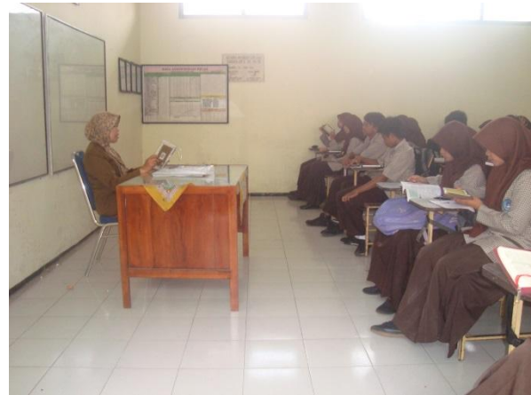
Guru piket menghukum peserta didik yang terlambat sambil diberi sedikit ceramah