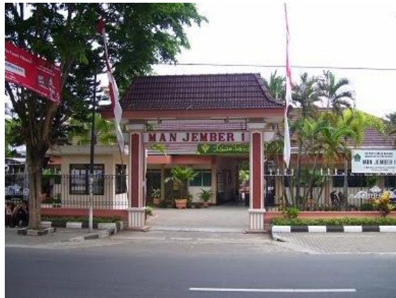
Gerbang depan masuk MAN 1 Jember