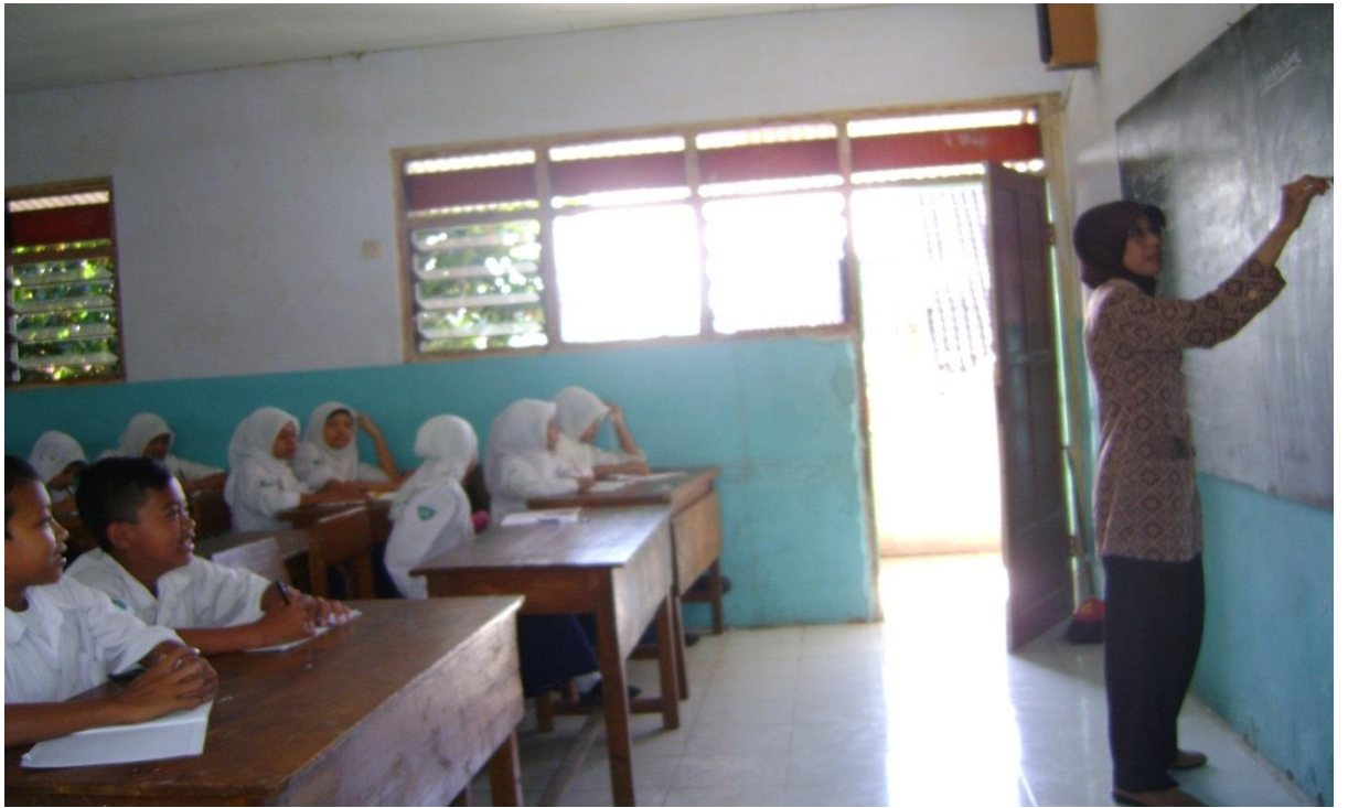
Suasana proses belajar mengajar di SMP NU Hasyim Asy'ari