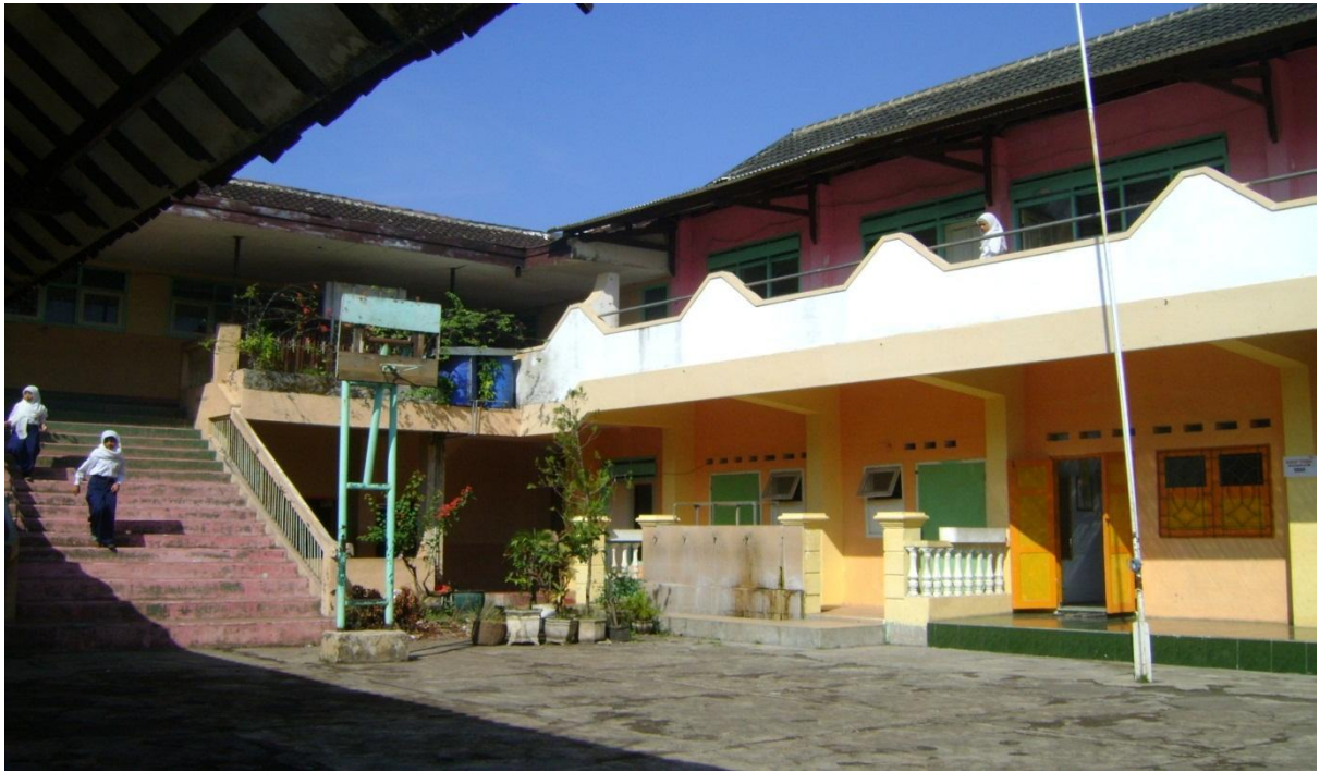
Suasana lingkungan SMP NU Hasyim Asy'ari