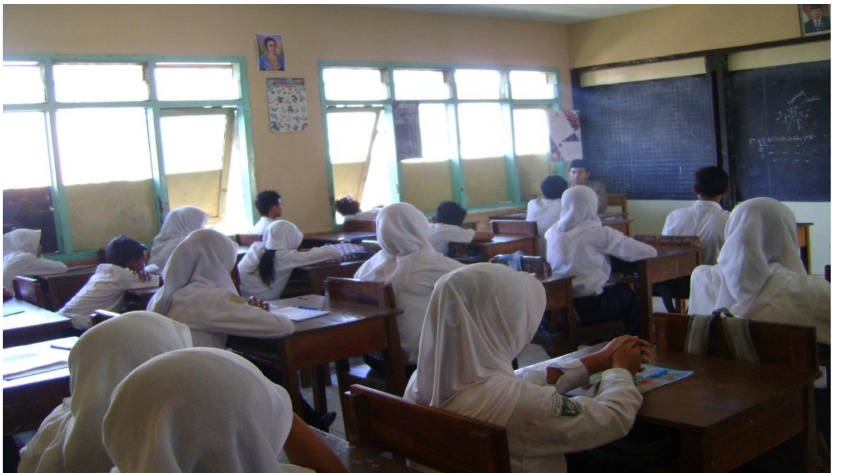
Suasana proses belajar mengajar di SMP NU Hasyim Asy'ari