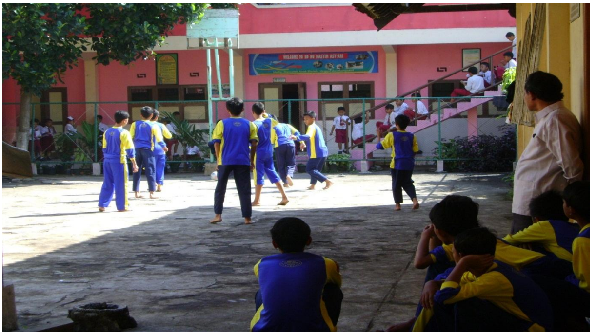
Suasana saat olahraga di SMP NU Hasyim Asy'ari