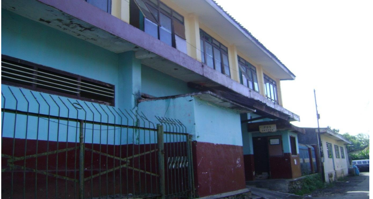
Tampak Gedung SMP NU Hasyim Asy'ari dari luar